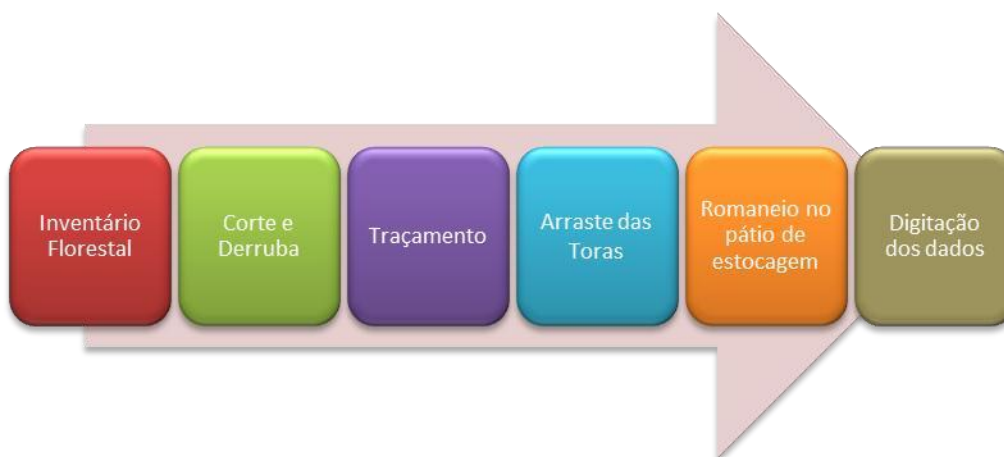
Figura 2: Atividades que participam do controle e monitoramento da cadeia de custódia da madeira.

Para o rastreamento da madeira nas diversas etapas do manejo, serão desenvolvidas algumas atividades que visam garantir o controle de toda a cadeia da madeira desde a árvore que será explorada até a saída da unidade de processamento industrial.