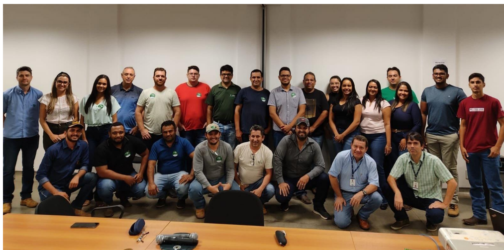
Turma reunida após muita troca de conhecimento