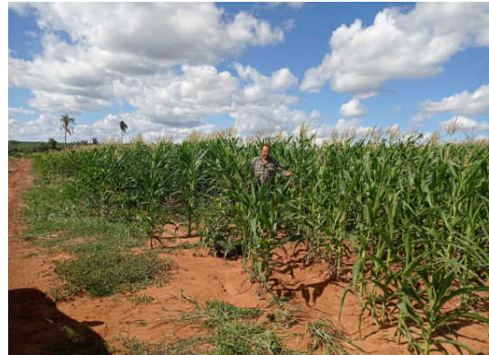
Antes e depois do trabalho conjunto na silagem do milho

Clique aqui para conferir mais detalhes do trabalho realizado no MS.