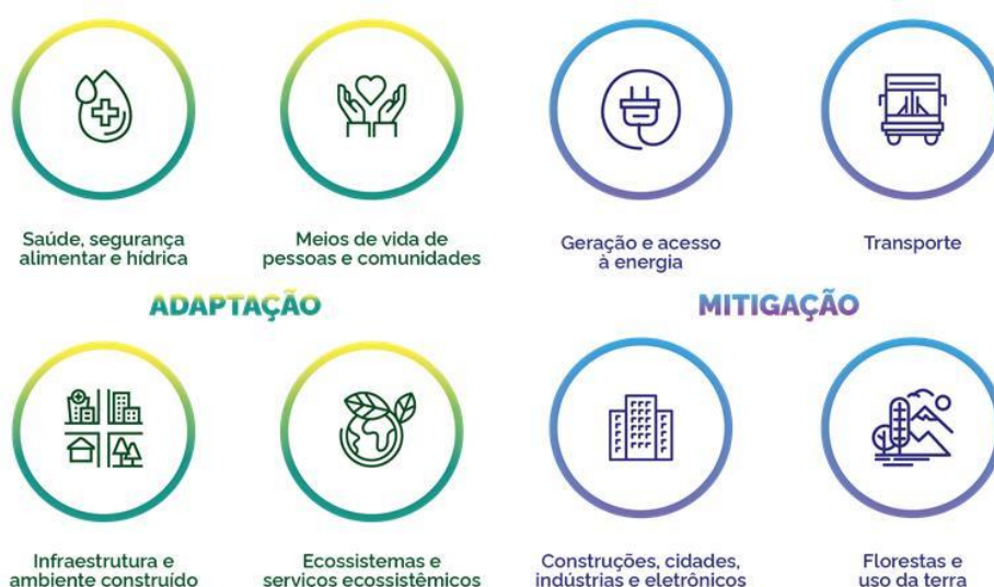
Figura 1: Áreas de resultado do GCF.

As consultas online realizadas em 2025 confirmaram a relevância desses eixos, com ênfases específicas que refletem o contexto atual. As respostas indicaram uma predominância de setores ligados ao AFOLU 9 (agricultura, agropecuária, agricultura familiar, florestas e pecuária), seguidos de indústria, energia, transportes e biocombustíveis. Também foram destacadas as áreas de saneamento, resíduos sólidos e cidades, reforçando a importância da adaptação climática e da infraestrutura resiliente.