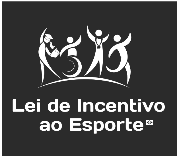
Versão monocromática negativa

Quando não for possível o uso da versão principal nas cores originais comprometendo a leitura de todos os elementos da marca, utiliza-se a versão monocromática negativa ou positiva.