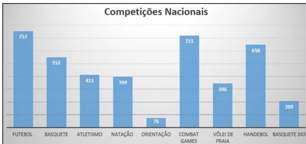
Figura 01: Quantidade de participantes nas competições nacionais por modalidade

Na Figura 01 “Competições Nacionais”, apresenta-se o número de participantes por modalidade: