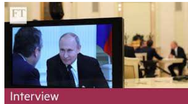
Vladimir Putin in a Financial Times interview. June 27, 2019

«The liberal idea has become obsolete. It has come into conflict with the interests of the overwhelming majority of the population»