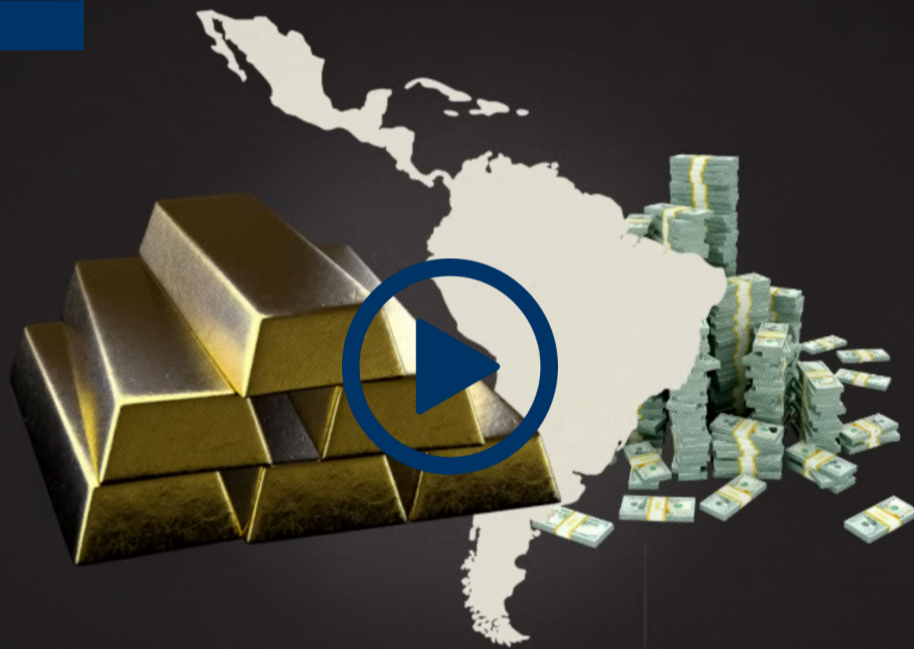
Cómo el narco usa el oro para lavar dinero