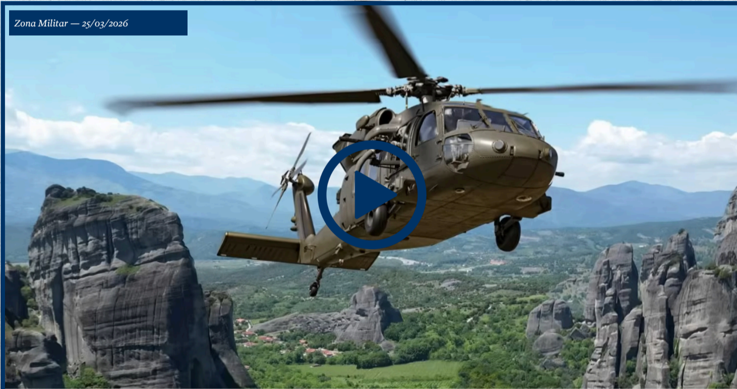
Argentina acuerda con EE.UU. la compra de helicópteros UH-60 Black Hawk para el Ejército