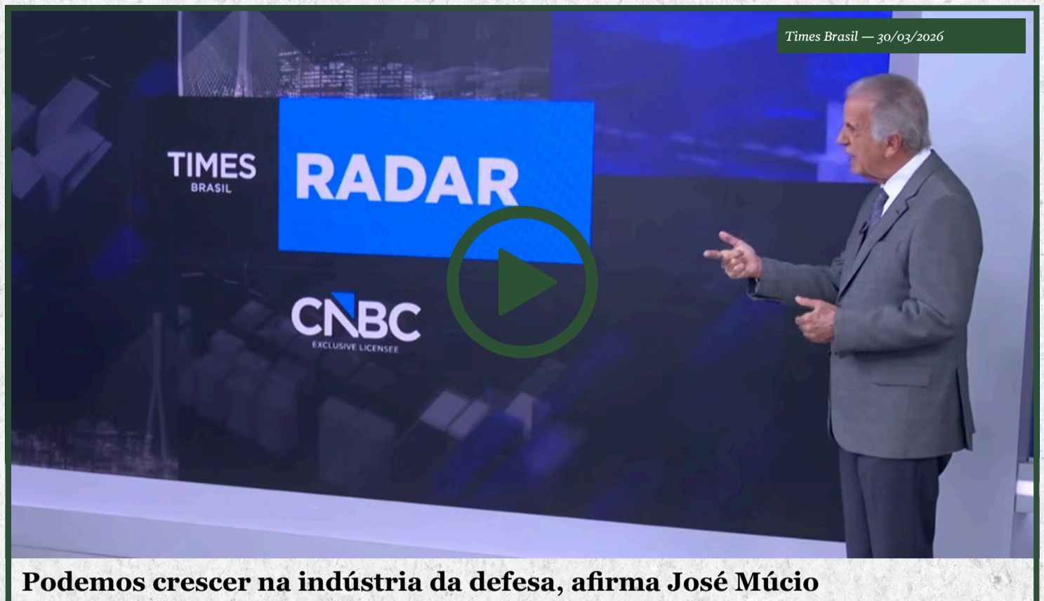
Podemos crescer na indústria da defesa, afirma José Mucio

O Ministro da Defesa, José Mucio Monteiro, participou, nesta segunda-feira (30), em Brasília (DF), da assinatura de convênio entre a Agência Brasileira de Promoção de Exportações e Investimentos (Apex-Brasil) e a Associação Brasileira das Indústrias de Materiais de Defesa e Segurança (Abimde). O acordo, no valor de R$ 19,6 milhões, tem como objetivo impulsionar as exportações do setor de defesa e segurança, ampliando a presença de empresas brasileiras em mercados estratégicos. O documento foi firmado pelo presidente da ApexBrasil, Jorge Viana, pelo presidente da Abimde, Luiz Teixeira, e contou ainda com a assinatura do ministro da Defesa, José Mucio. Na ocasião, o ministro José Mucio destacou que o fortalecimento do país passa pelo investimento em áreas estruturantes do desenvolvimento nacional. “Vejo defesa na educação, na ciência, na tecnologia ● ● ●