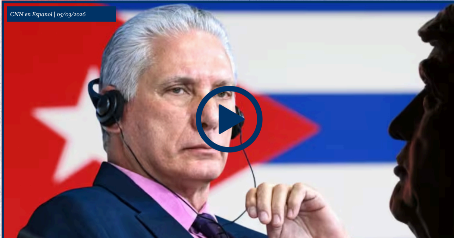
Los factores internacionales que facilitaron las conversaciones entre Cuba y EE.UU.