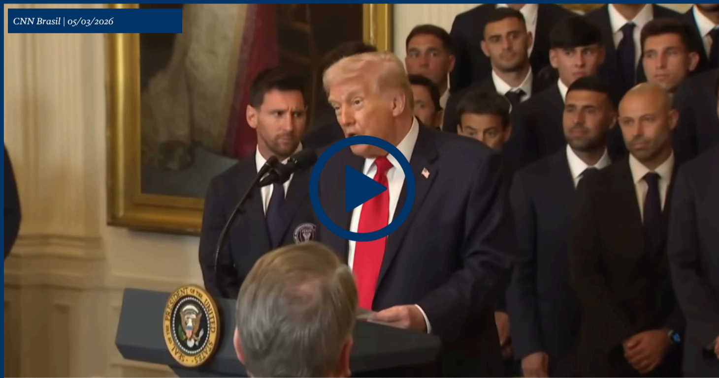
Trump fala em "questão de tempo" sobre Cuba após finalizar guerra com Irã