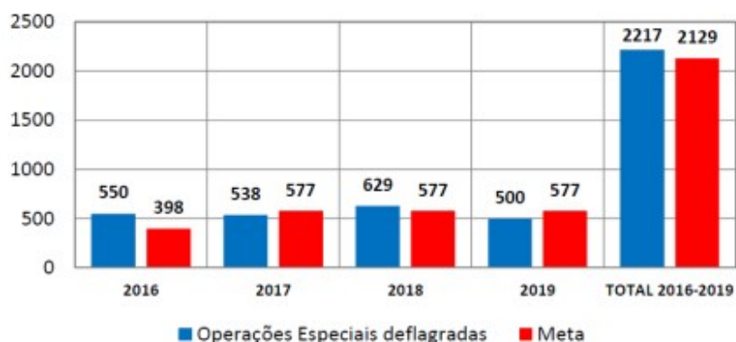
Gráfico 01 - Comparativo entre os números de Operações Especiais deflagradas entre os anos de 2016 e 2019, com as respectivas metas estabelecidas junto ao Ministério da Justiça e Segurança Pública.

Relacionada à temática de proteção aos Direitos Humanos a PRF registrou em 2019, o total de 2.326 entre ocorrências Contra a Dignidade Sexual, Contra a Família, Contra a Organização do Trabalho, Contra a Pessoa, e de crimes enquadrados no Estatuto da Criança e do Adolescente, no Estatuto do Idoso e no Estatuto do Estrangeiro. Foram resgatadas 75 pessoas desaparecidas, 312 vítimas de tráfico de pessoas, 117 crianças em situação de trabalho infantil, 446 adultos em situação de trabalho escravo e 123 crianças vítimas de exploração sexual.