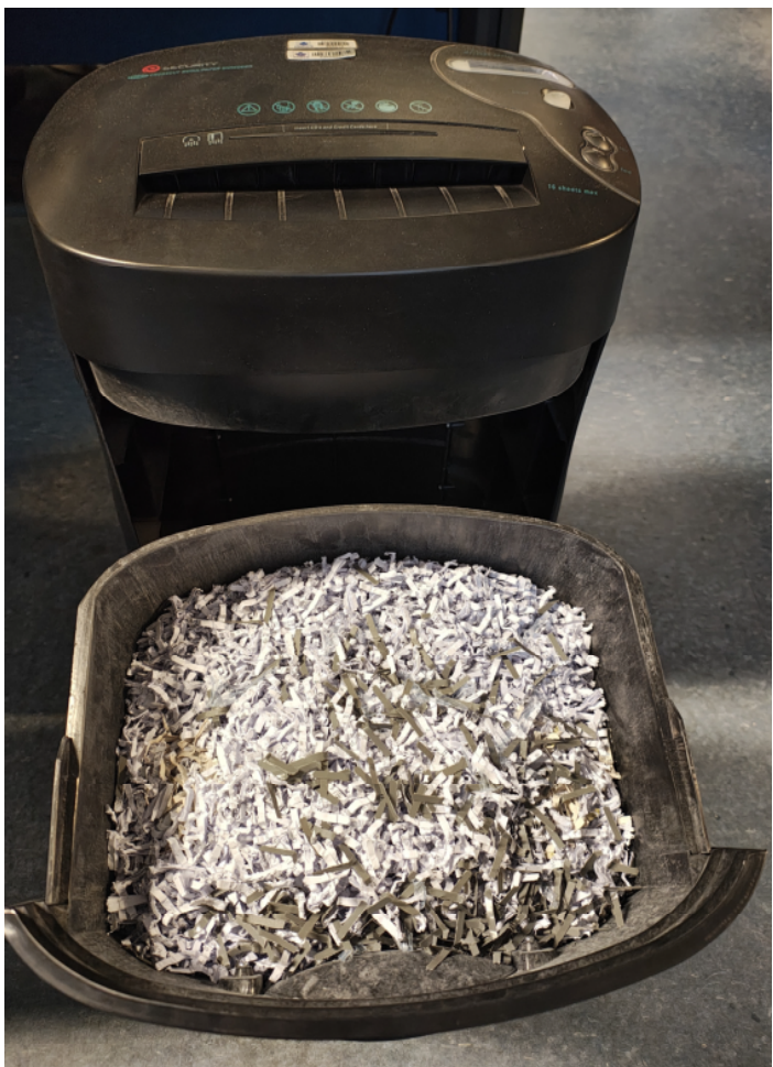
Registro Fotográfico - Desfragmentadora e Coletores (1891751)