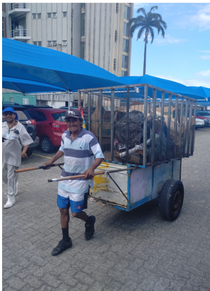
Registro Fotogr_Coletor de Resíduos Recicláveis (1903816)