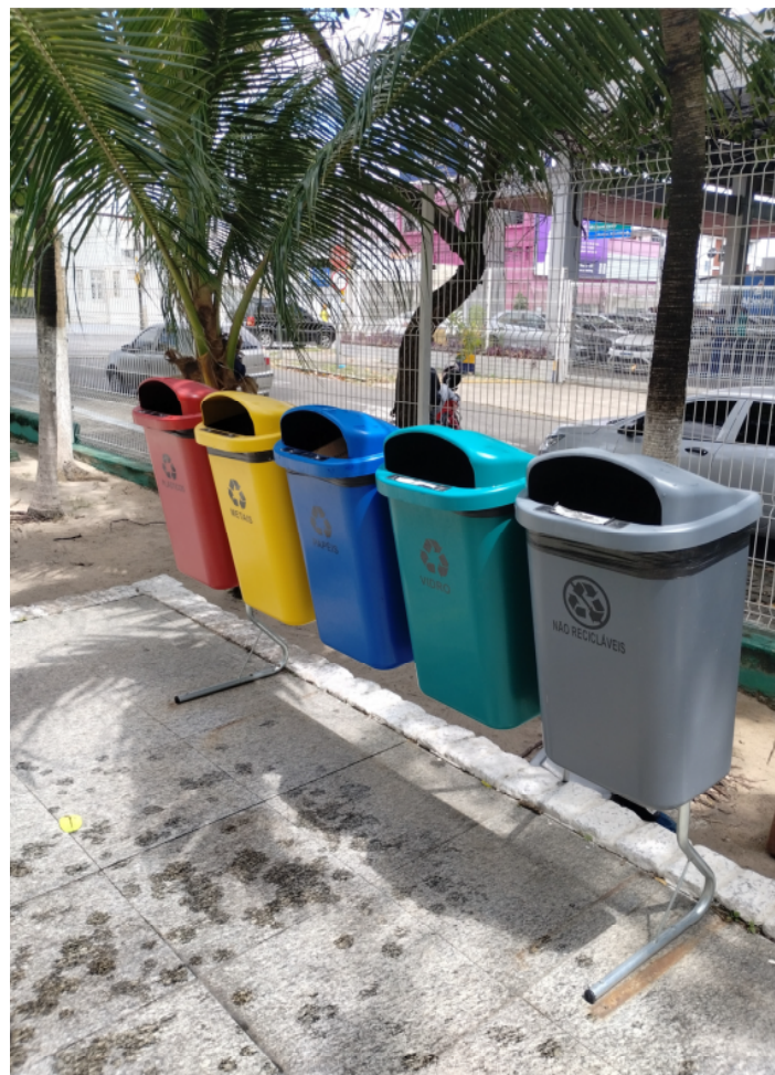
Registro Fotográfico - Desfragmentadora e Coletores (1891751)