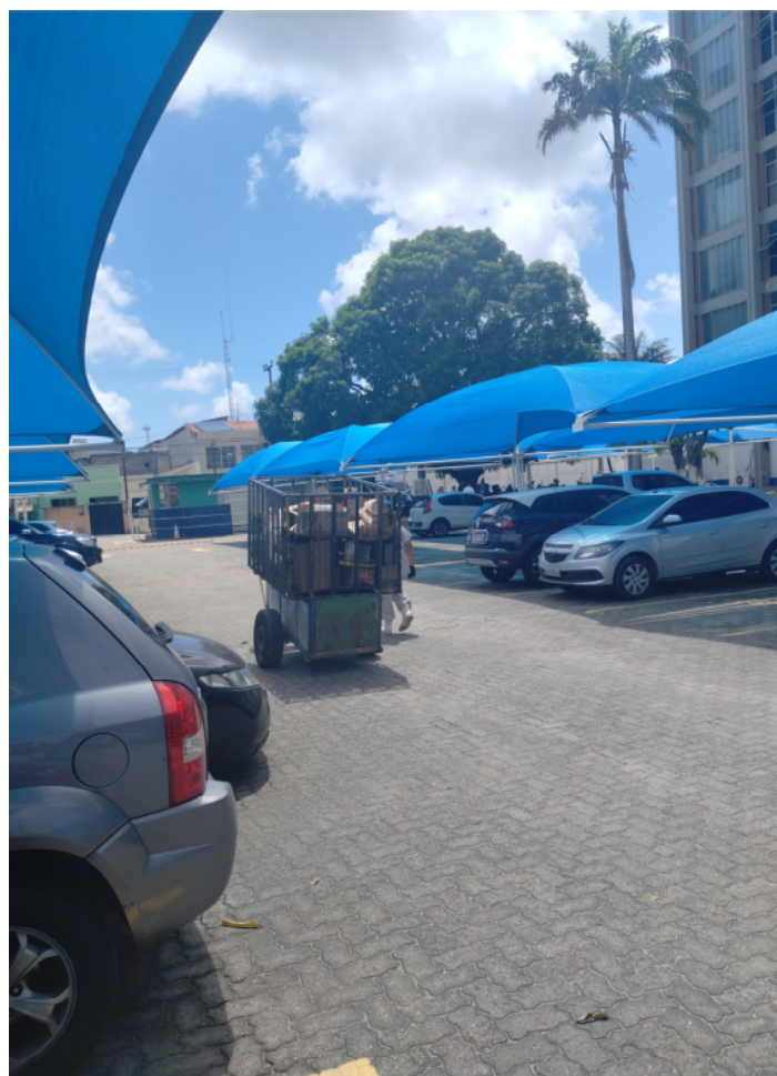
Registro Fotogr_Coletor de Resíduos Recicláveis (1903816)