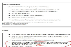
Imagem.jpg 38 KB