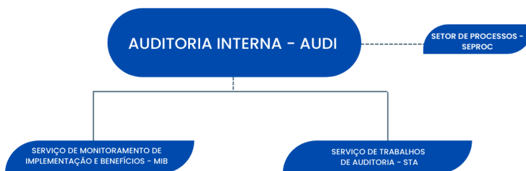
Figura 1 – Organograma da Unidade de Auditoria Interna do DNOCS

A força de trabalho, no final de 2025, consistia em 05 (cinco) servidores, sendo 01 (um) Auditor-Chefe, 01 (um) Assistente Técnico, 03 (três) Técnicos voltados às ações de auditoria e ao monitoramento de recomendações, bem como ao setor de processos, conforme abaixo especificado: