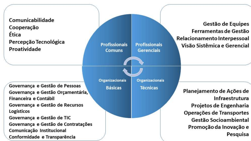
Figura 1 - Macrocompetências do DNIT

Com base nessas competências revisadas, foi aplicado em todas as Superintendências Regionais, Administrações Hidroviárias, Diretorias e Órgãos Seccionais do DNIT, por meio de um questionário online , o Levantamento das Necessidades de Capacitação – LNC. Por meio dele, foram levantados 1.113 eventos de capacitação, que incluem cursos, treinamentos, seminários e congressos, entre outros.