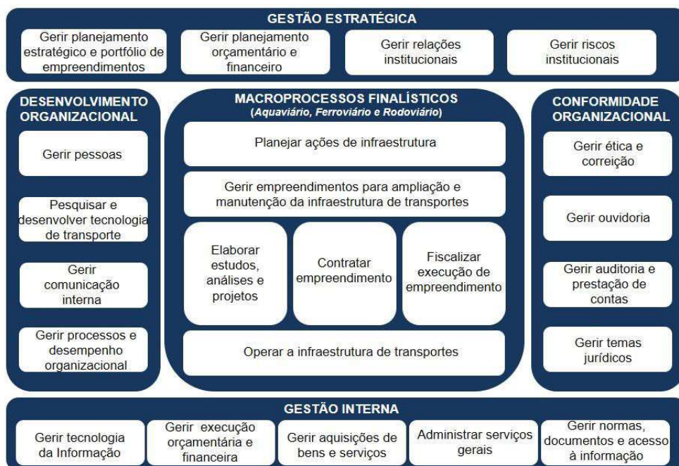
Figura 4 - Cadeia de valor do DNIT