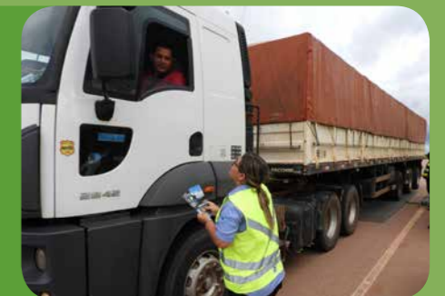
Programa de Comunicação Social