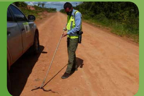
Programa de Prevenção de Colisão de Fauna Silvestre