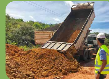
Programa de Supervisão Ambiental