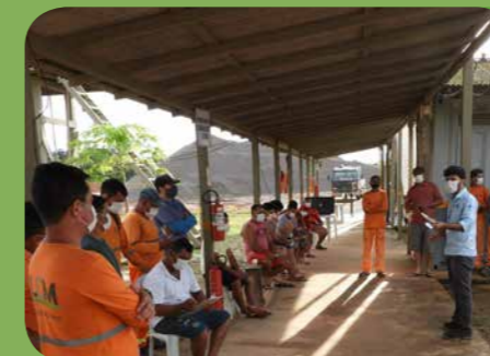
Programa de Educação Ambiental