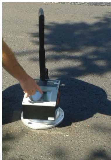
Figura A3 – Densímetro não nuclear de mistura asfáltica