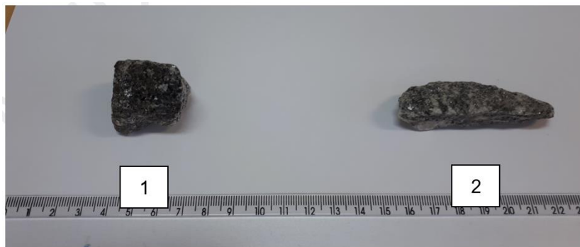
Figura A3 – Foto de dois agregados: Agregado (1) partícula não achatada e alongada e Agregado (2) partícula achatada e alongada.