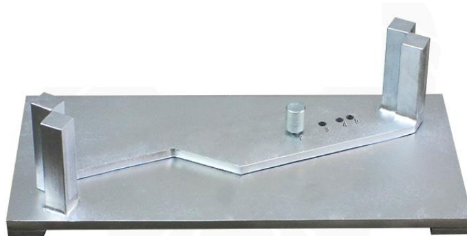
Figura A2 – Cálibre proporcional para medir partículas achatadas e alongadas.