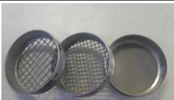
Peneiras redondas de caixilho de 210 mm