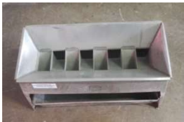
Repartidor de amostra