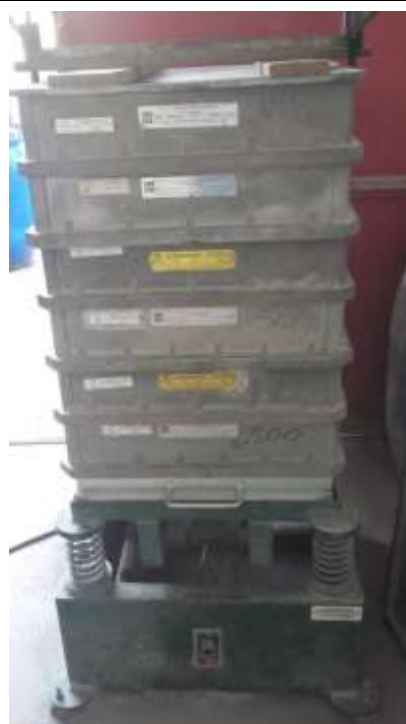
Peneirador com uma série de peneiras quadradas