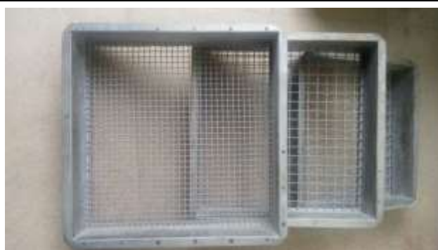
Peneiras quadradas de caixilho de 500 x 500 mm