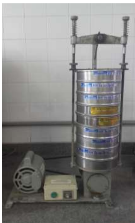
Peneirador com uma série de peneiras redondas