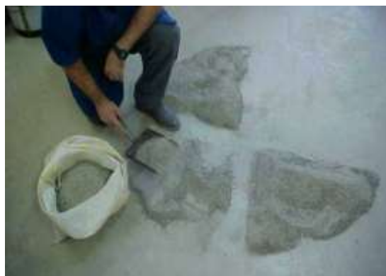
Quarteamento de amostra