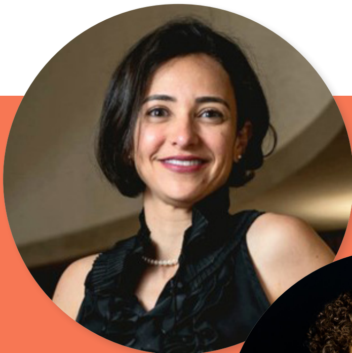
Izabela Moreira Correa Secretária de Integridade Pública da CGU