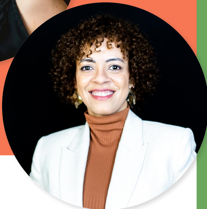
Ana Túlia de Macedo Secretária Nacional de Acesso à Informação