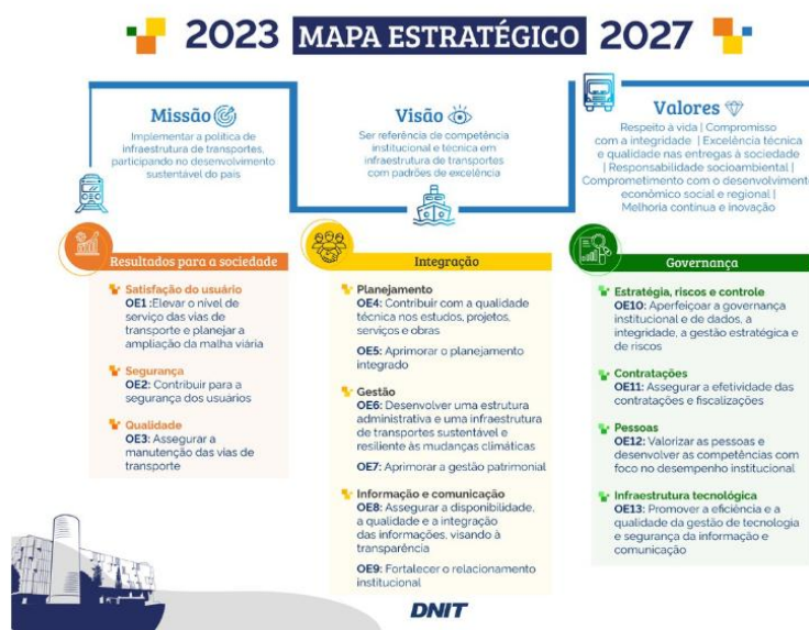
Figura 1 - Mapa Estratégico 2023-2027 do DNIT

O planejamento estratégico institucional vigente (2023–2026) estabelece a missão, visão e valores que orientam a atuação da Autarquia, bem como os objetivos estratégicos voltados à ampliação da entrega de valor à sociedade. Esses objetivos estão diretamente relacionados à melhoria da segurança e da satisfação dos usuários, à elevação da qualidade da infraestrutura de transportes, à eficiência na aplicação dos recursos públicos, ao fortalecimento da transparência e ao aprimoramento contínuo da governança institucional.