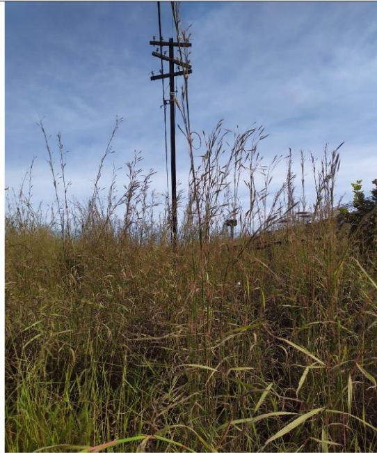
Foto 17 - Poste de Trilho - TR25 - 8 metros.