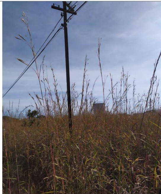
Foto 23 - Poste de Trilho - TR25 - 8 metros.