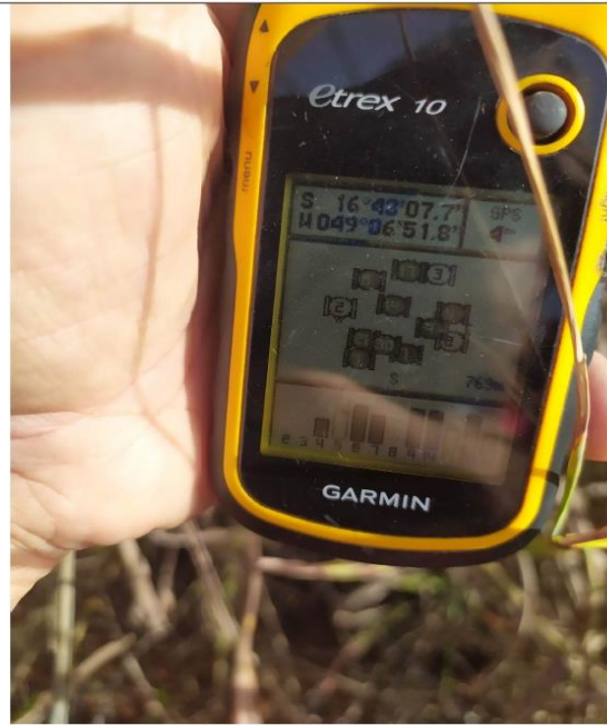
Foto 22 - Localização