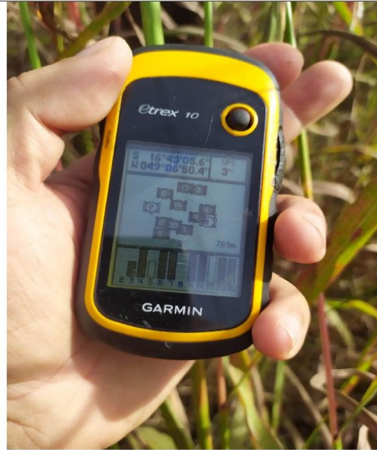
Foto 18 - Localização