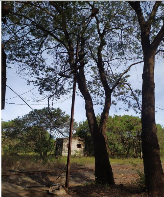
Foto 01 - Poste de Trilho - TR25 - 8 metros.