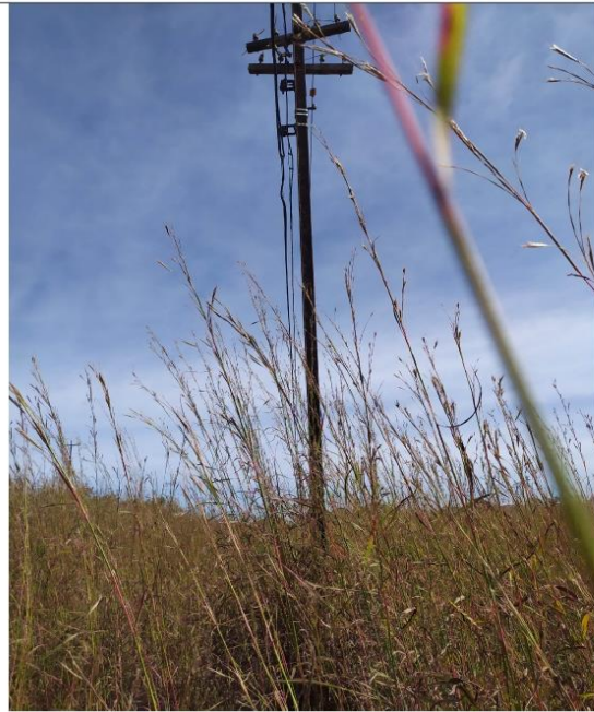
Foto 21 - Poste de Trilho - TR25 - 8 metros.