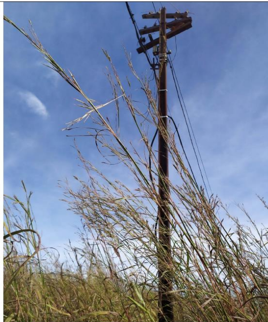
Foto 19 - Poste de Trilho - TR25 - 8 metros.