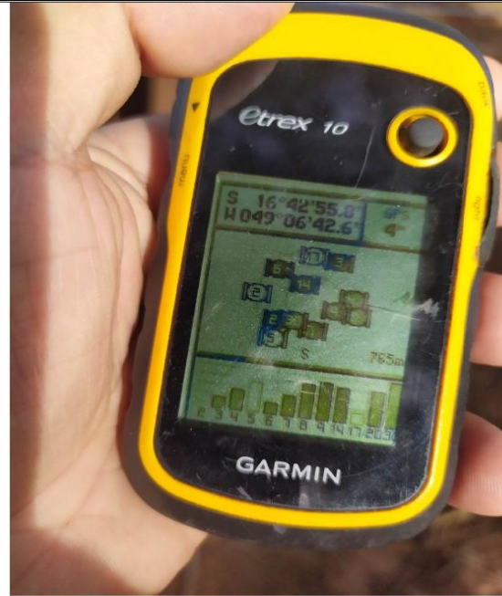
Foto 02 - Localização.