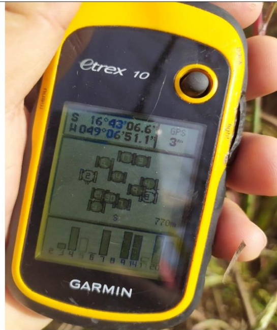
Foto 20 - Localização