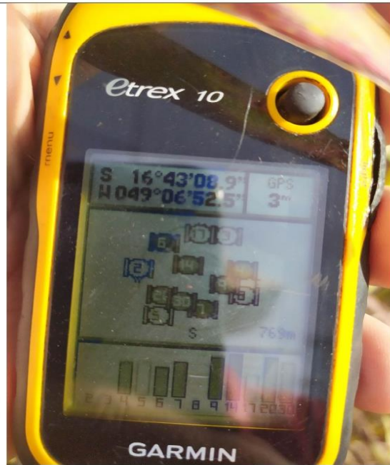
Foto 27 - Localização