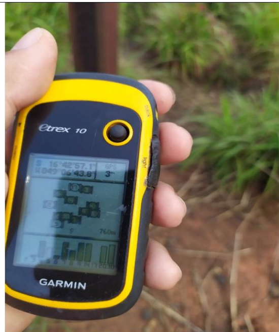
Foto 04 - Localização.