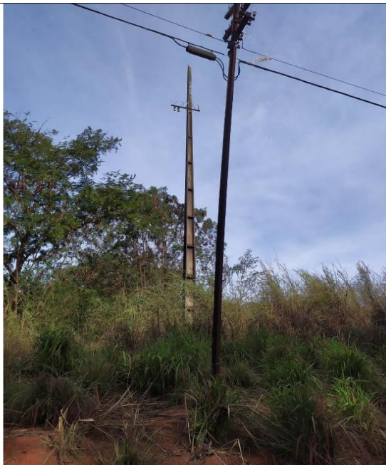
Foto 03 - Poste de Trilho - TR25 - 8 metros.