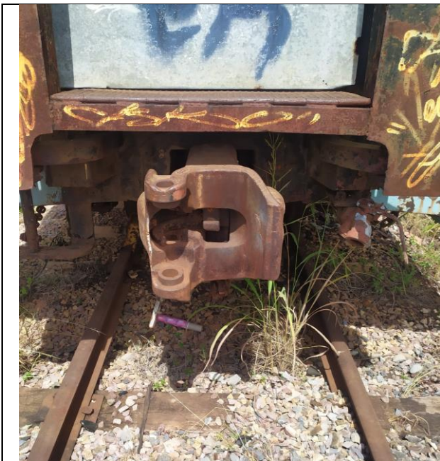
Engate, com ACT, sem mandíbula.