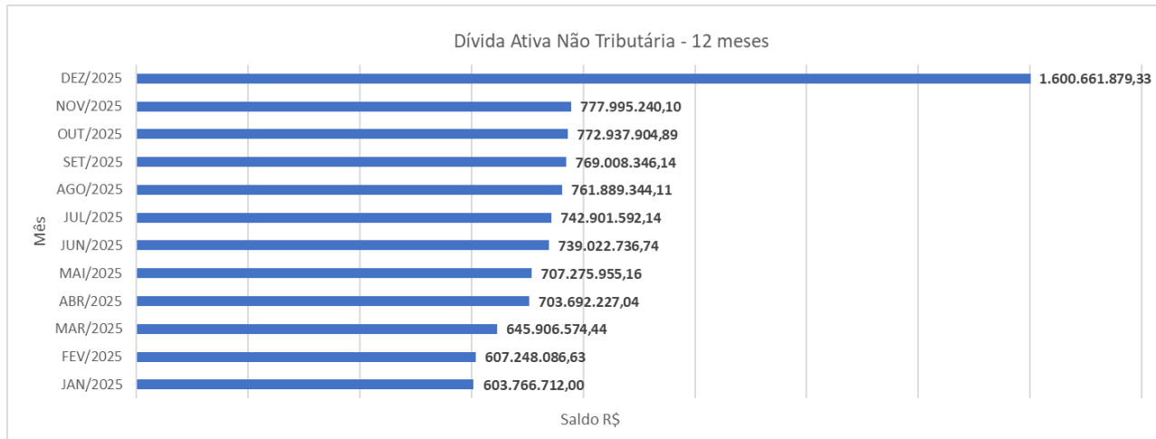
Gráfico 1: Dívida Ativa Não Tributária:

O Gráfico 1 demonstra a evolução dos créditos do DNIT inscritos em Dívida Ativa Não Tributária nos últimos doze meses.