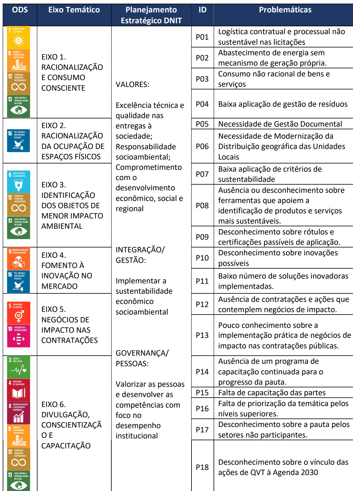
Tabela 2: ODS x Eixos Temáticos x Planejamento Estratégico do DNIT x Problemáticas