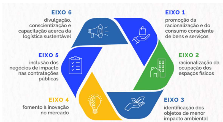
Figura 1: Caderno de Logística do PLS - 6 EIXOS

A inovação trazida pela Portaria 5.376/2023 consiste, na primeira etapa, em elencar as diretrizes normativas e principiológicas, conhecer e caracterizar a logística das licitações da instituição para então definir situações problema existentes de cada um dos Temas do PLS relativas aos 6 Eixos preestabelecidos pelo Caderno de Logística.