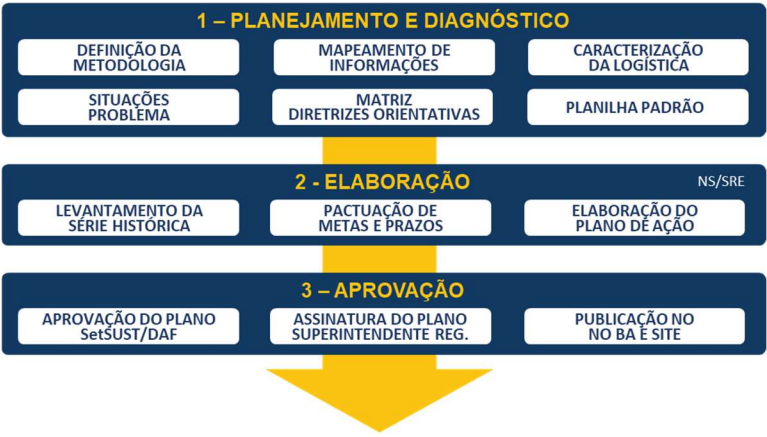
Figura 2: Metodologia da elaboração do PLS/SRE/DNIT

A figura abaixo ilustra as etapas desde o planejamento até a aprovação e publicação do PLS: