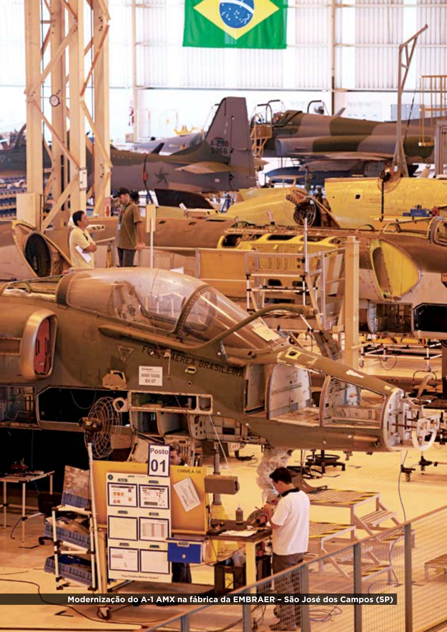
Modernização do A-1 AMX na fábrica da EMBRAER – São José dos Campos (SP)