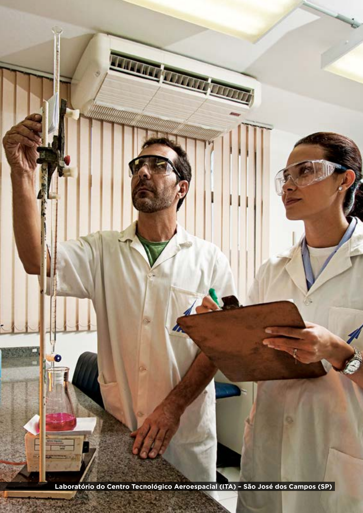
Laboratório do Centro Tecnológico Aeroespacial (ITA) – São José dos Campos (SP)

A segurança, em linhas gerais, é a condição em que o Estado, a sociedade ou os indivíduos se sentem livres de riscos, pressões ou ameaças, inclusive de necessidades extremas. Por sua vez, defesa é a ação efetiva para se obter ou manter o grau de segurança desejado.