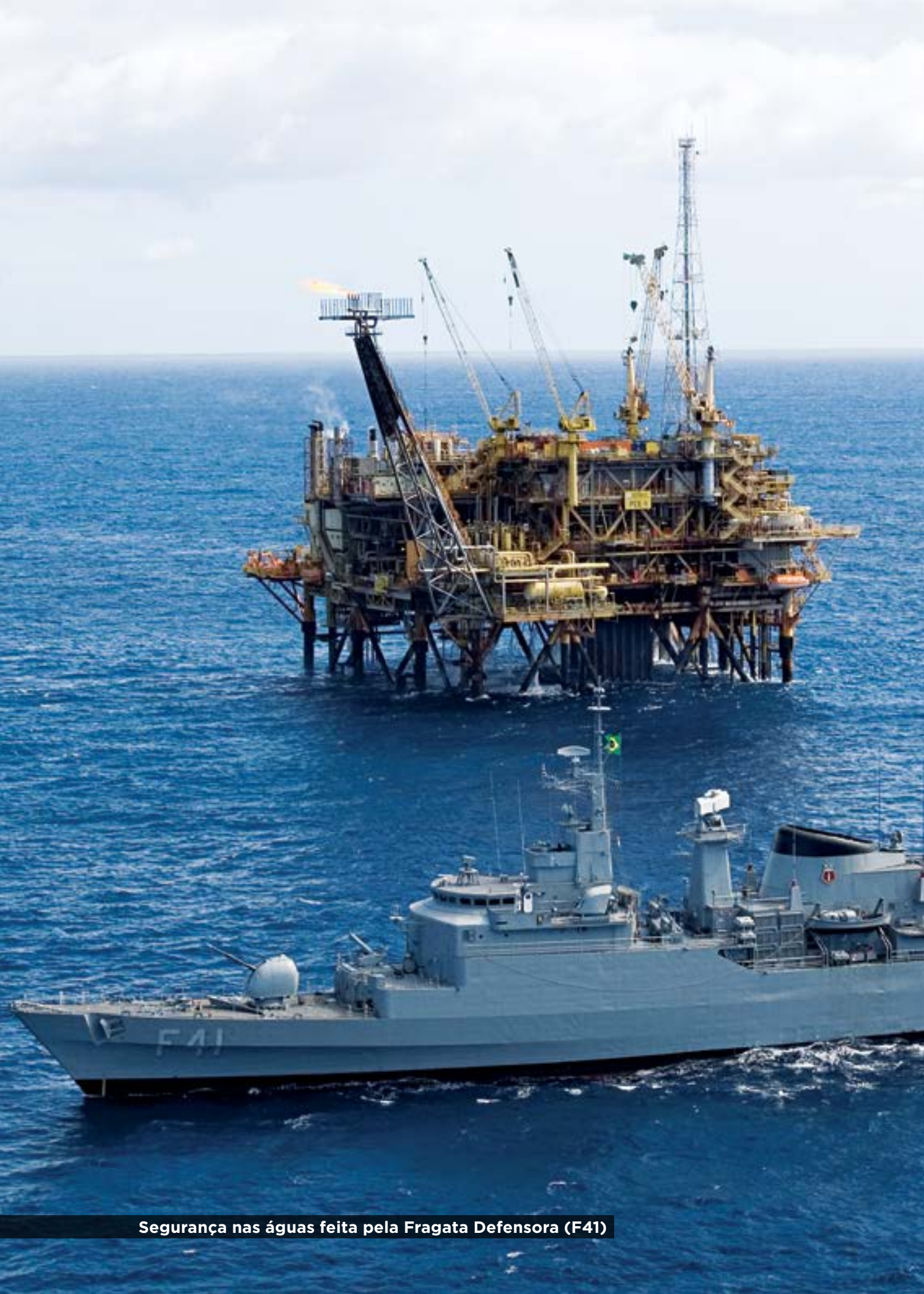
Segurança nas águas feita pela Fragata Defensora (F41)