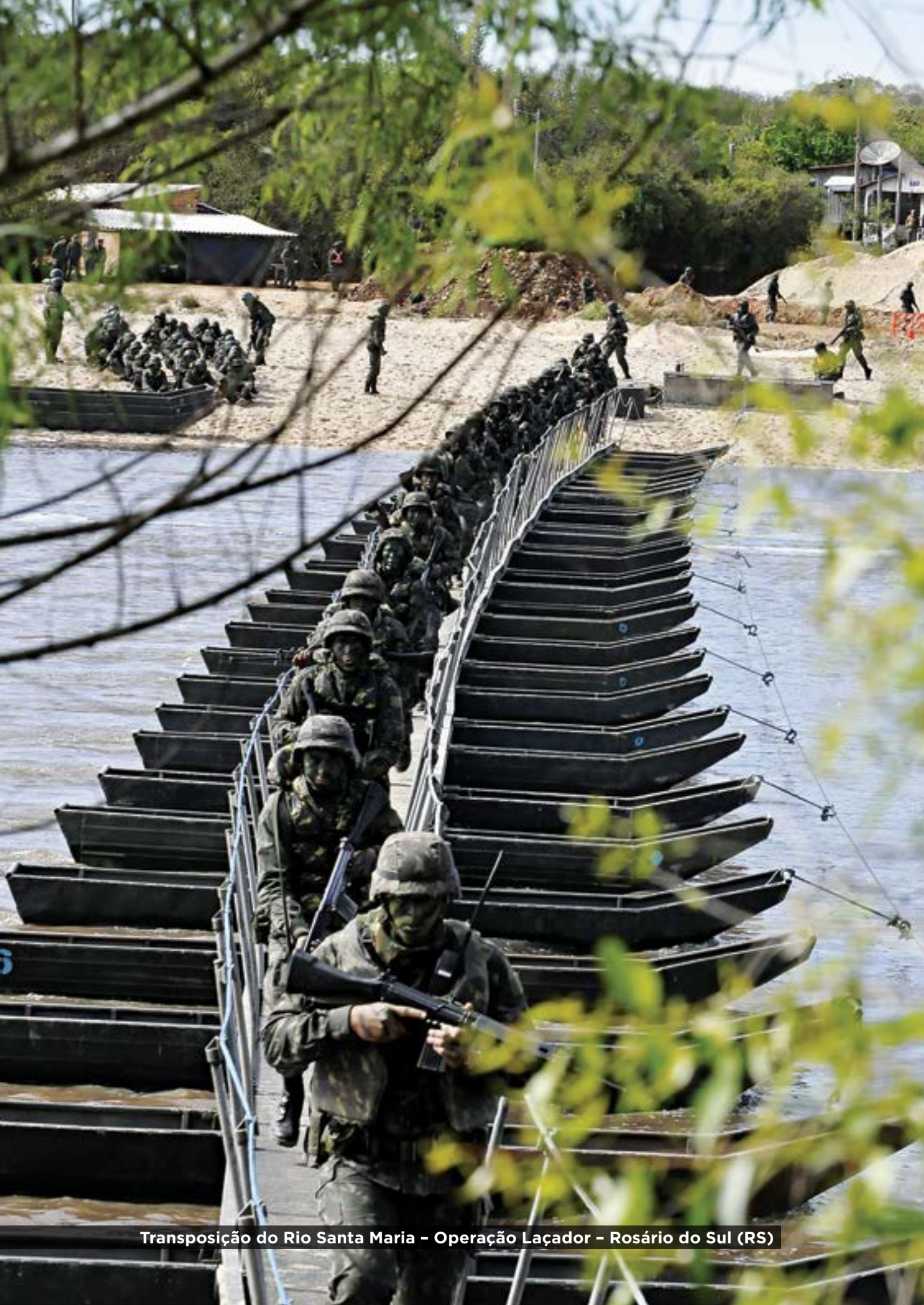
Transposição do Rio Santa Maria – Operação Laçador – Rosário do Sul (RS)

A flexibilidade relativiza o contraste entre o conflito convencional e o conflito não convencional: reivindica, para as forças convencionais, alguns dos atributos de força não convencional, e firma a supremacia da inteligência e da imaginação sobre o mero acúmulo de meios materiais e humanos. Por isso mesmo, rejeita a tentação de ver na alta tecnologia, alternativa ao combate, assumindo-a como um reforço da capacidade operacional. Insiste no papel da surpresa. Transforma a incerteza em solução, em vez de encará-la como problema. Combina as defesas meditadas com os ataques fulminantes.