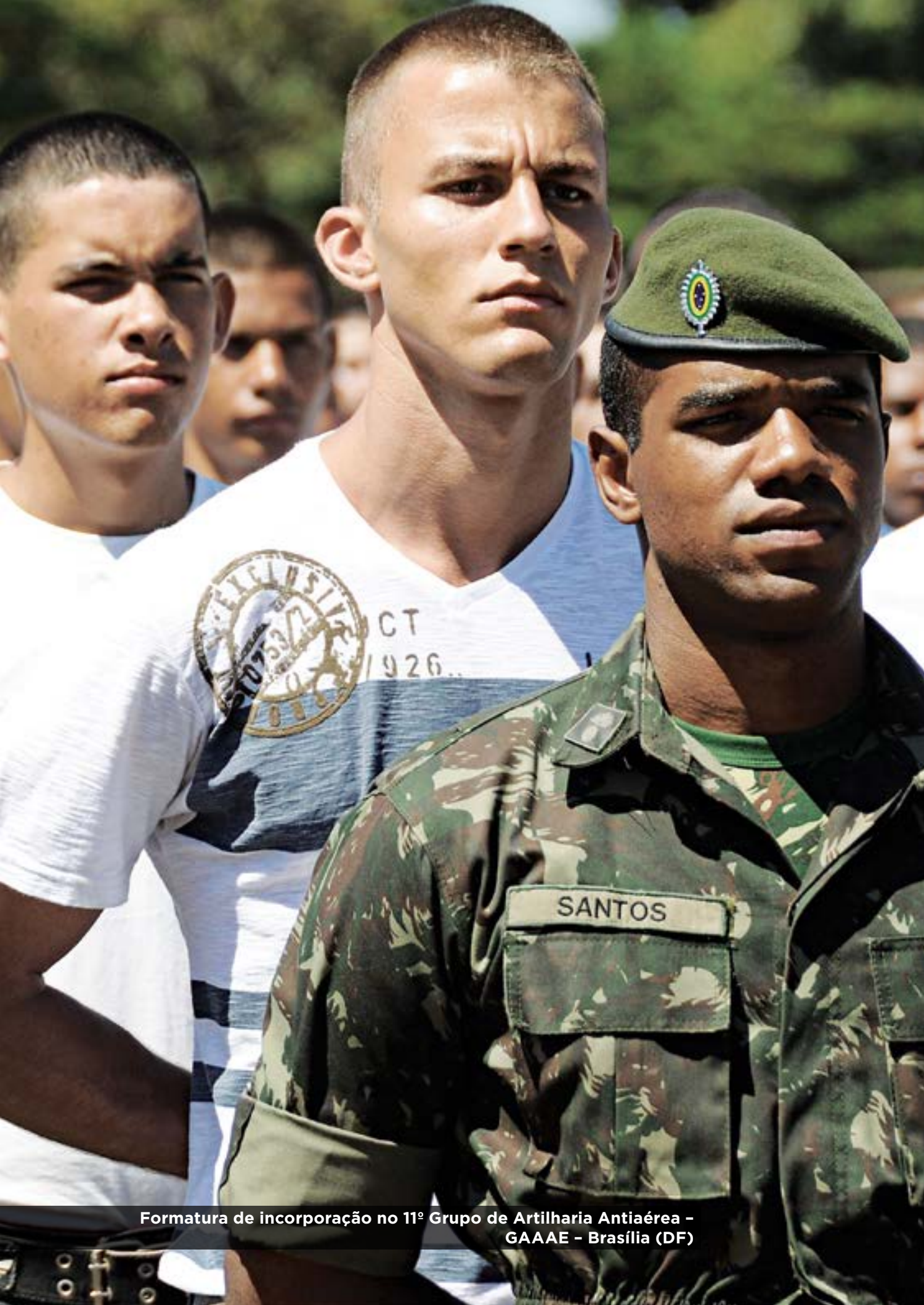
Formatura de incorporação no 11º Grupo de Artilharia Antiaérea – GAAAE – Brasília (DF)

O conflito entre as vantagens do profissionalismo e os valores do recrutamento há de ser atenuado por meio da educação – técnica e geral, porém de orientação analítica e capacitadora