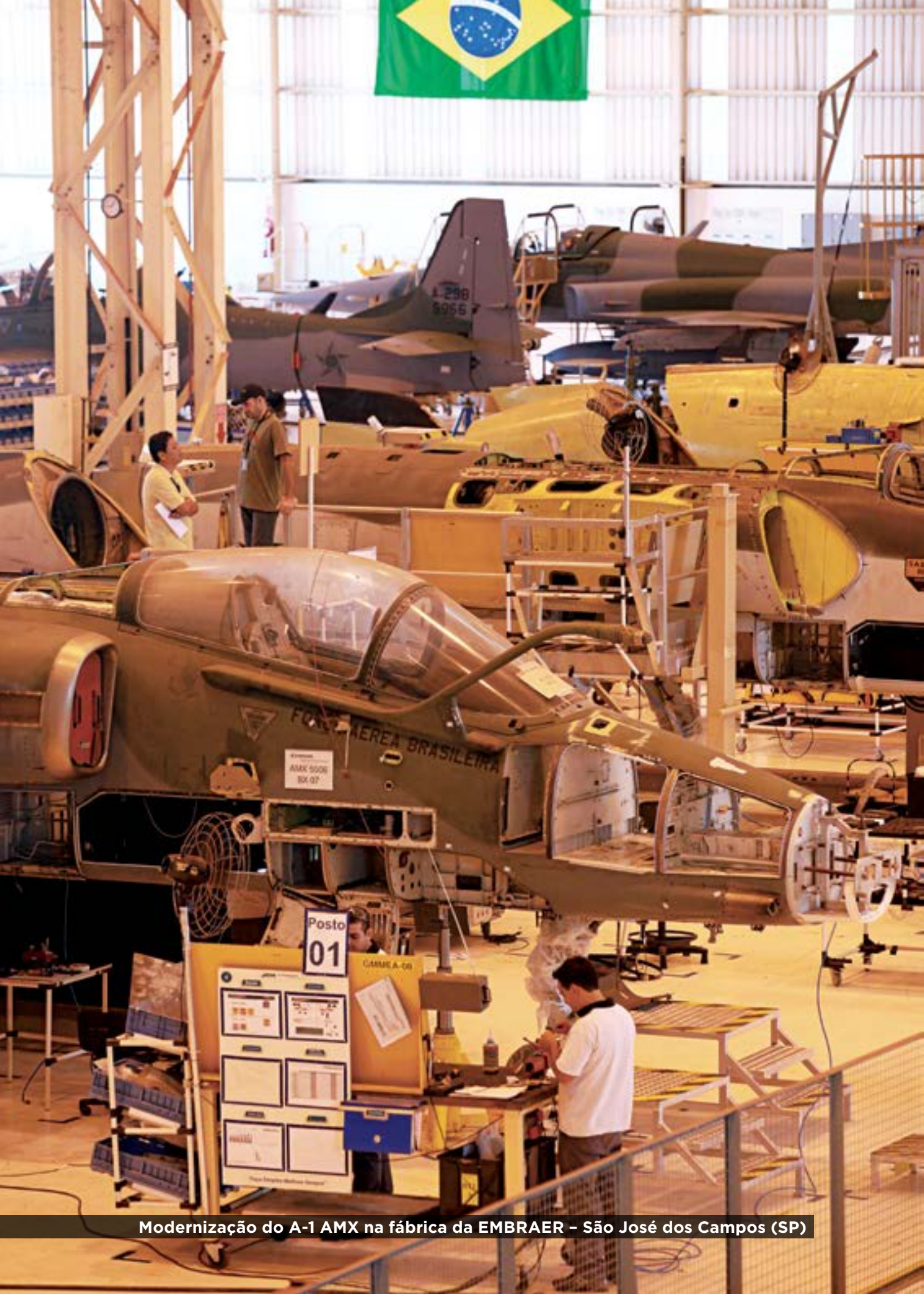
Modernização do A-1 AMX na fábrica da EMBRAER – São José dos Campos (SP)