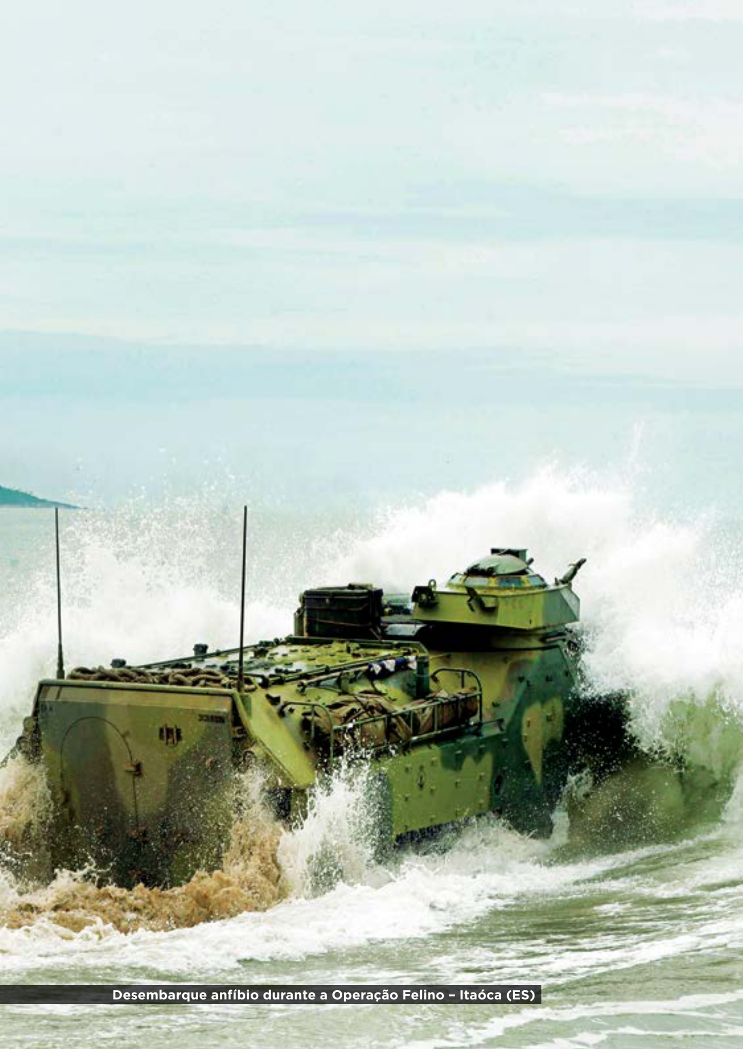
Desembarque anfíbio durante a Operação Felino – Itaóca (ES)

As organizações militares serão articuladas para conciliar o atendimento às hipóteses de emprego com a necessidade de otimizar os seus custos de manutenção e para proporcionar a realização do adestramento em ambientes operacionais específicos.