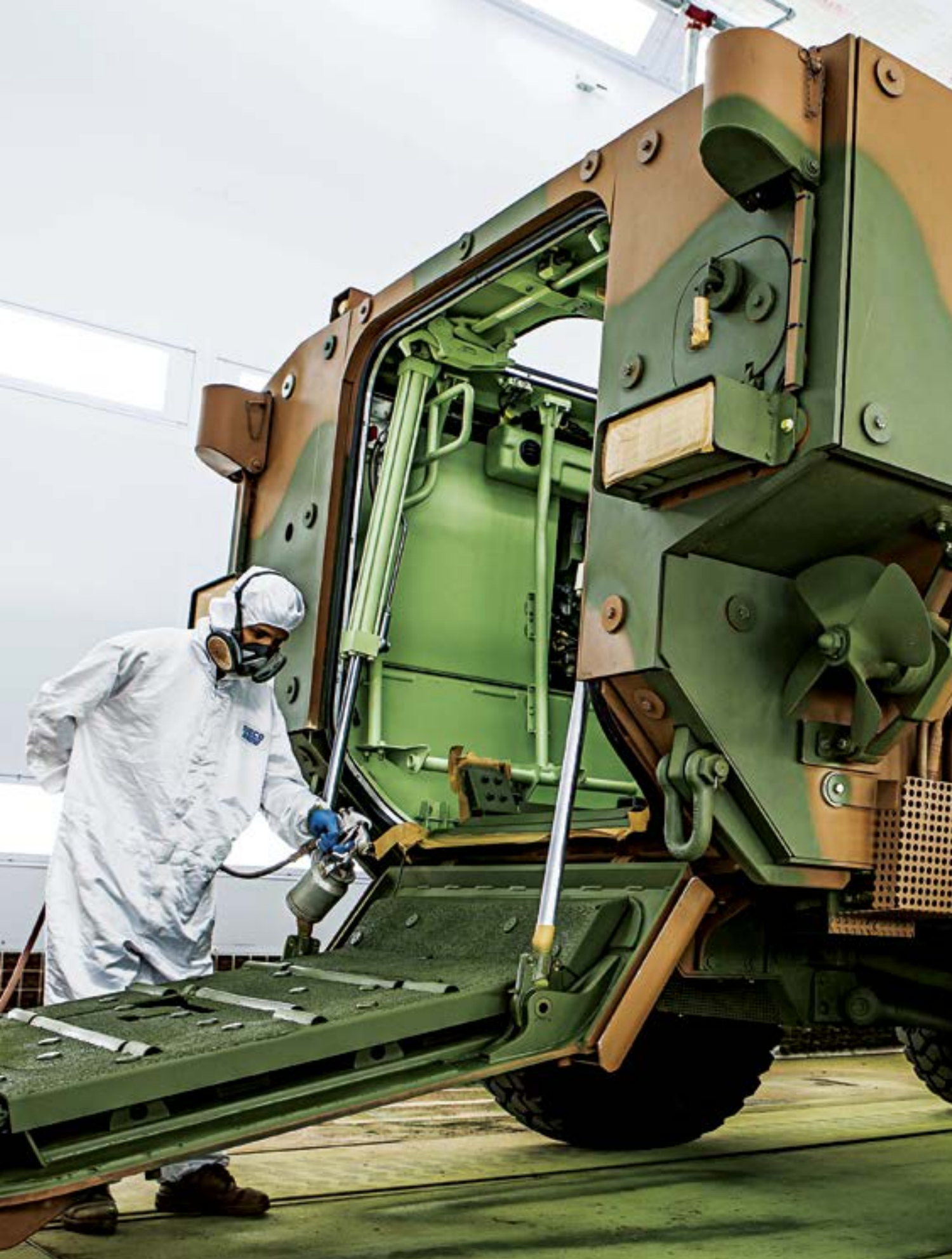
Linha de montagem do blindado Guarani – IVECO – Sete Lagoas (MG)

Deve-se cuidar para que a pesquisa de vanguarda resulte em produção de vanguarda.