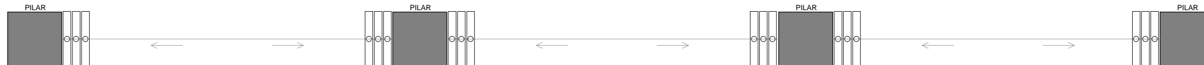
PLANTA BAIXA - ABERTO esc 1:50