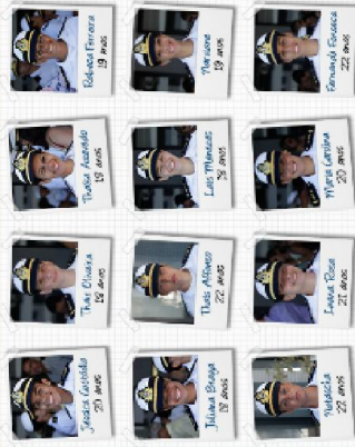
Primeira turma de mulheres da Escola Naval do Rio de Janeiro