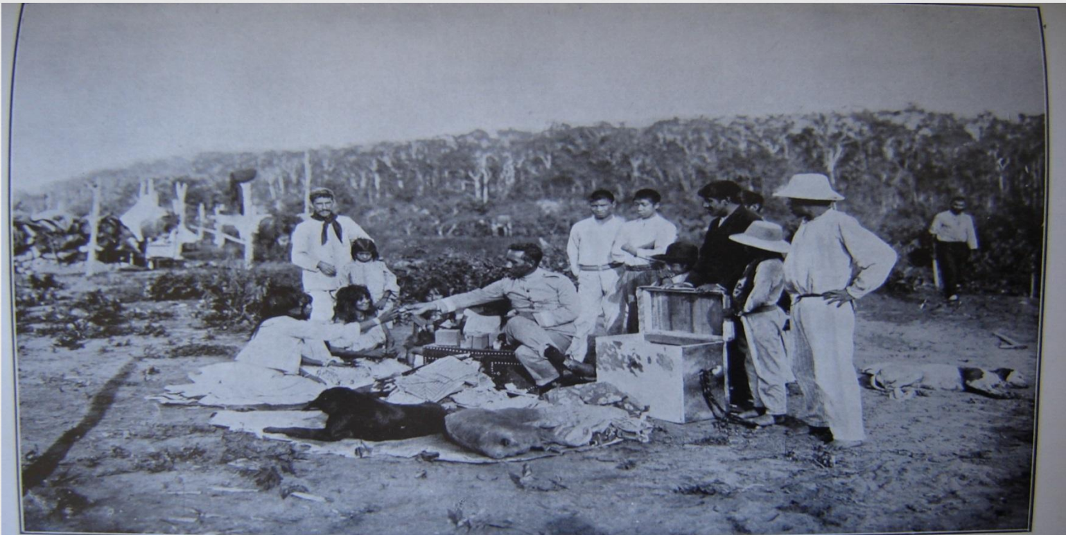
Distribuição de brinde aos Aritis—Caxinitis—Cuzul-Iná-sue Cabeceira do rio Santo Antonio — Expedição de 1907.