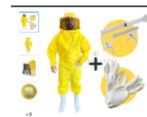
ITEM 9 Kit Roupa Apicultor