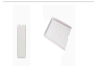
ITEM 7 – Display Acetato