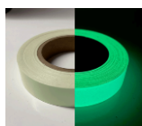
ITEM 13 Fita Adesiva Fotoluminescente