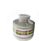
ITEM 5 Cartucho Multigases