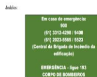
ITEM 14 Placa sinalizadora