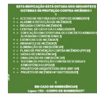
ITEM 15 Placa sinalizadora