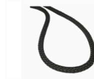
ITEM 6 Cordin (Cordelete)