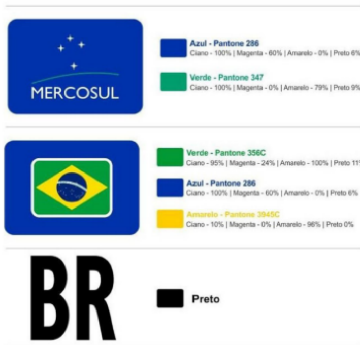
Fonte: Figura 4 do Anexo I da Resolução CONTRAN nº 969, de 20 de junho de 2022.