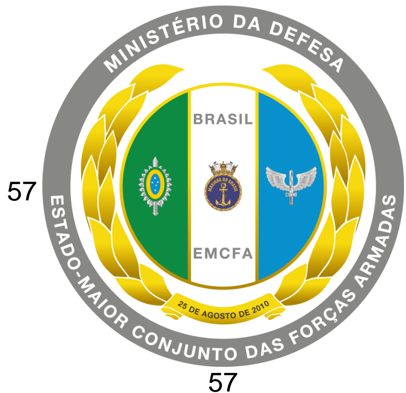
IMAGEM DE FUNDO