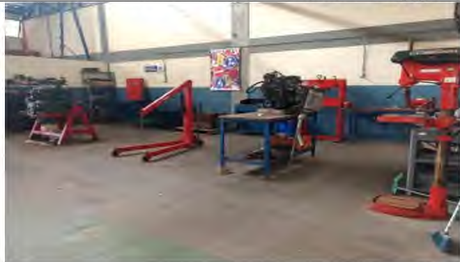
Com5ºDN – SEST/SENAT – Oficina Pedagógica