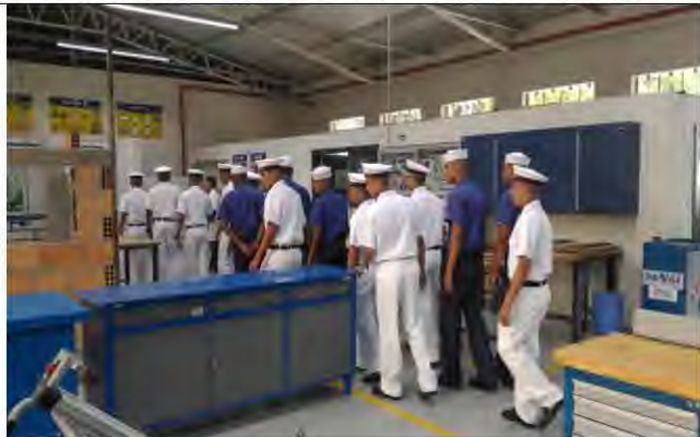
Com4ºDN - Curso de Pedreiro de Alvenaria