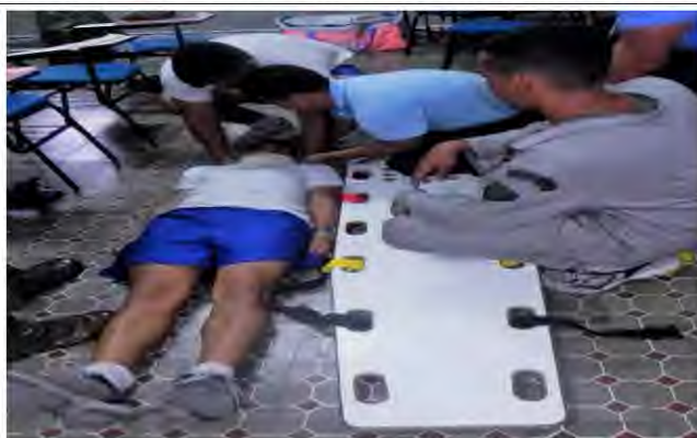
Com3ºDN - BNN – Aula de Primeiros Socorros