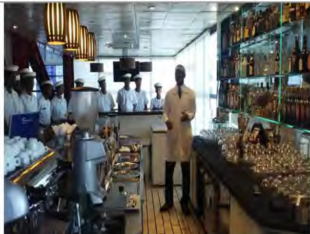
Com2ºDN – BNA – Curso de Garçon