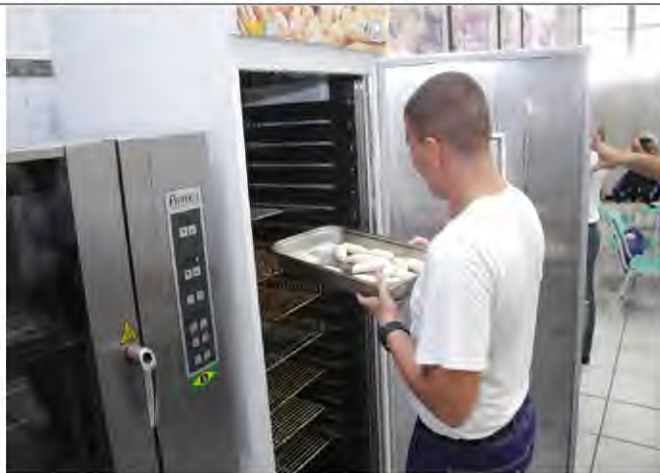
Com1ºDN - CIAA - Curso de Auxiliar de Padeiro