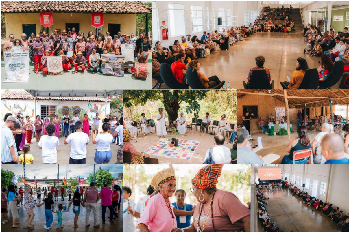
2ª Teia Estadual e 7º Fórum Estadual Cultura Viva