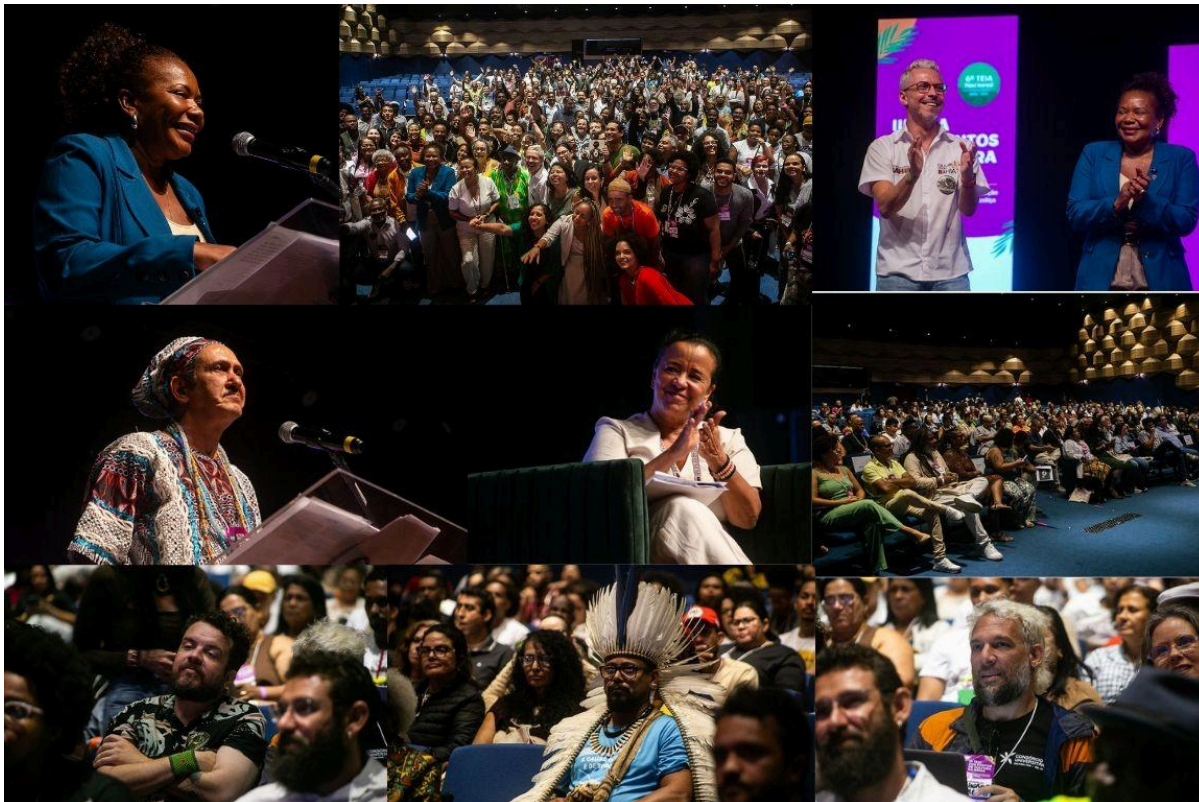
III Teia dos Pontos de Cultura da Bahia