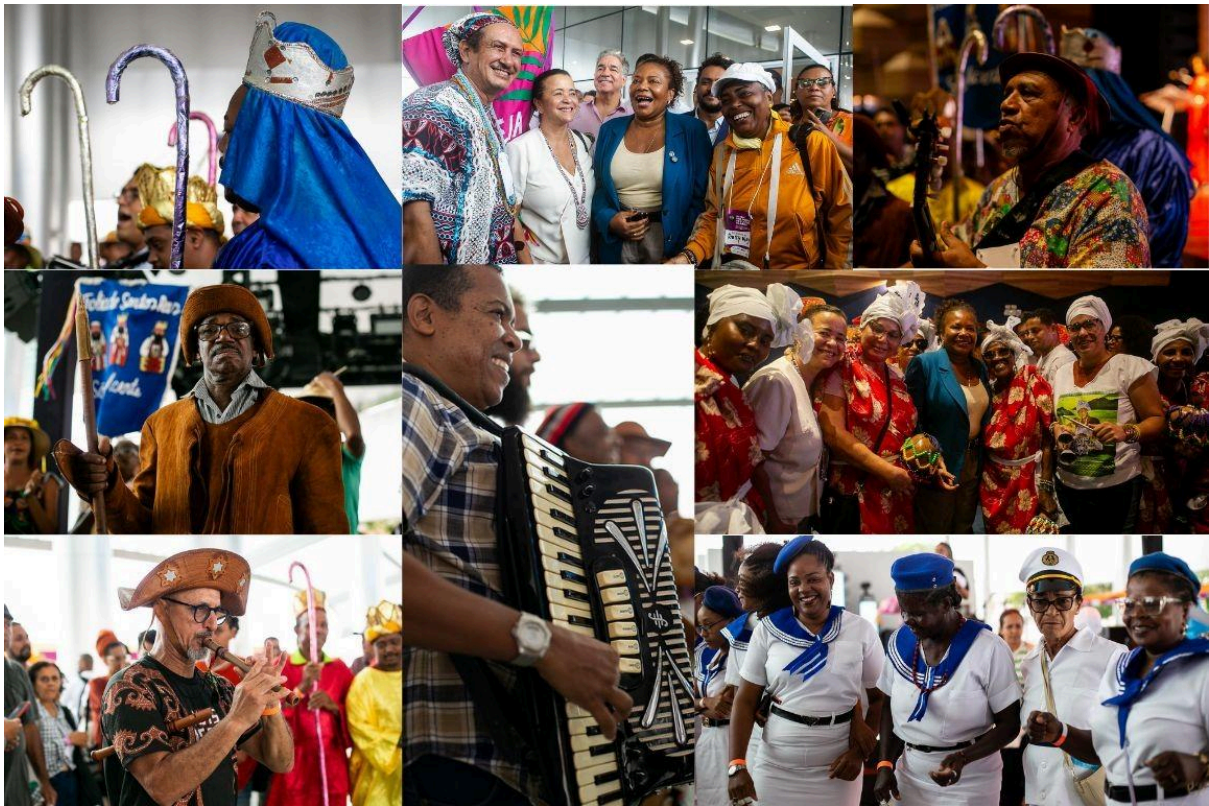
Abertura da III Teia da Bahia