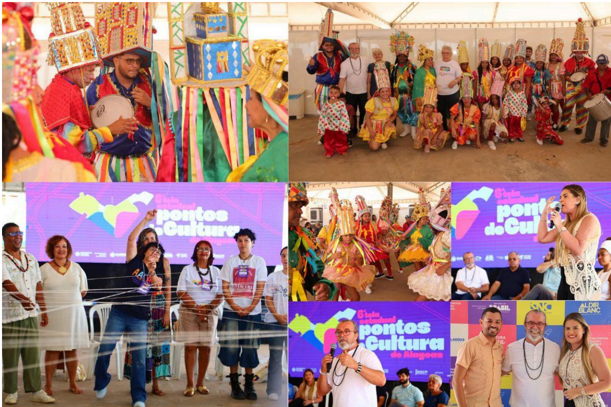
6ª Teia Estadual de Alagoas