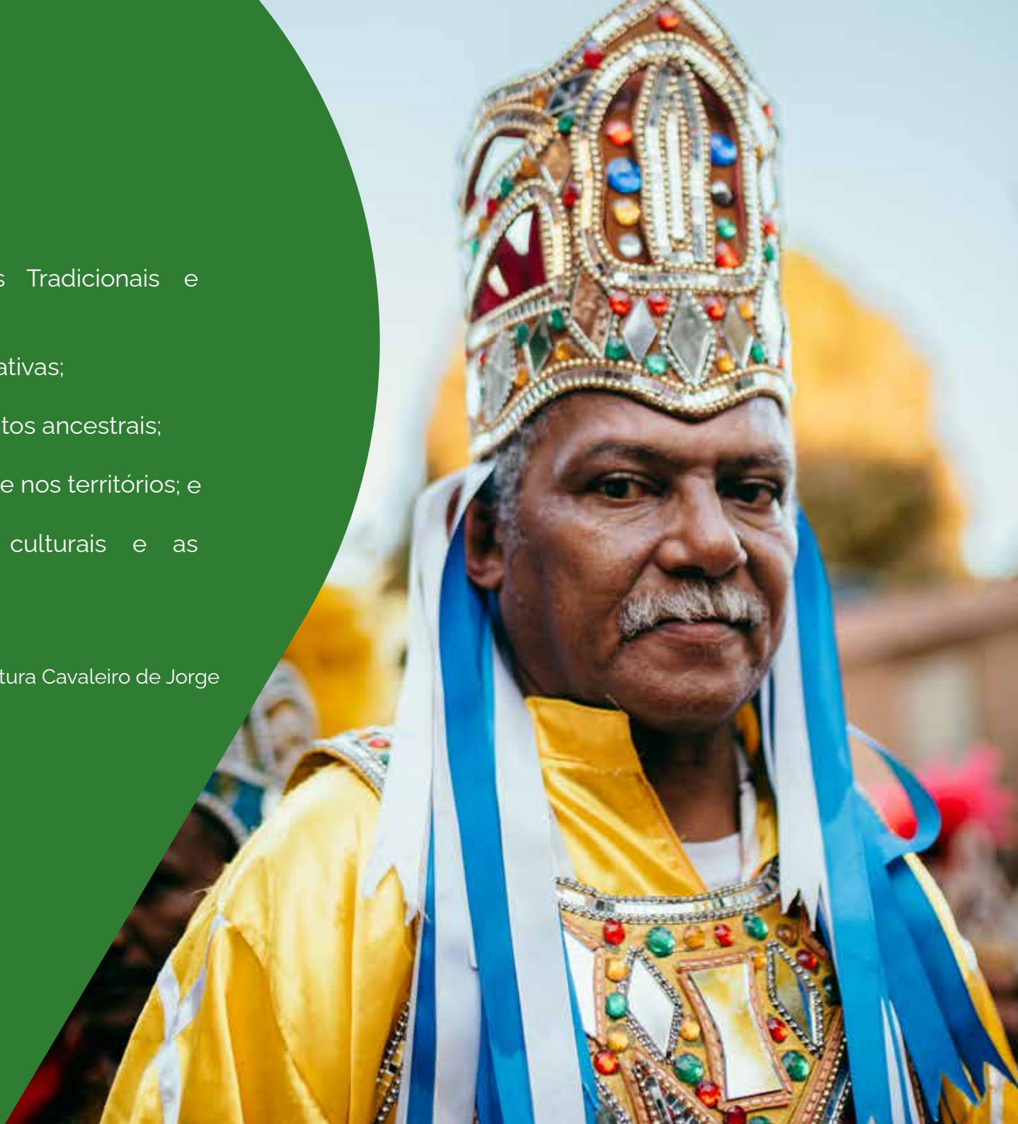
Foto: Reisado Discípulos do Mestre Pedro - CE Michelly Mattos/Pontão de Cultura Casa de Cultura Cavaleiro de Jorge