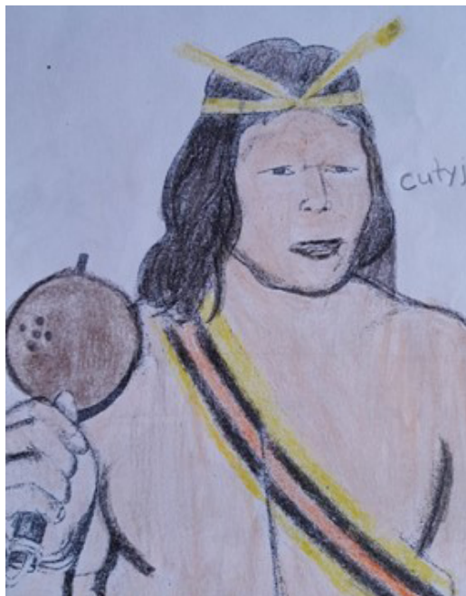
Figura 05 - Ilustração Krikati