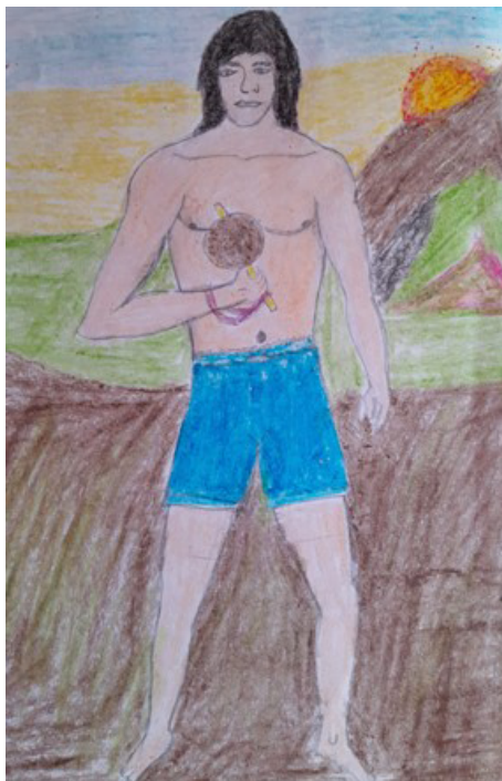
Figura 04 - Ilustração Krikati