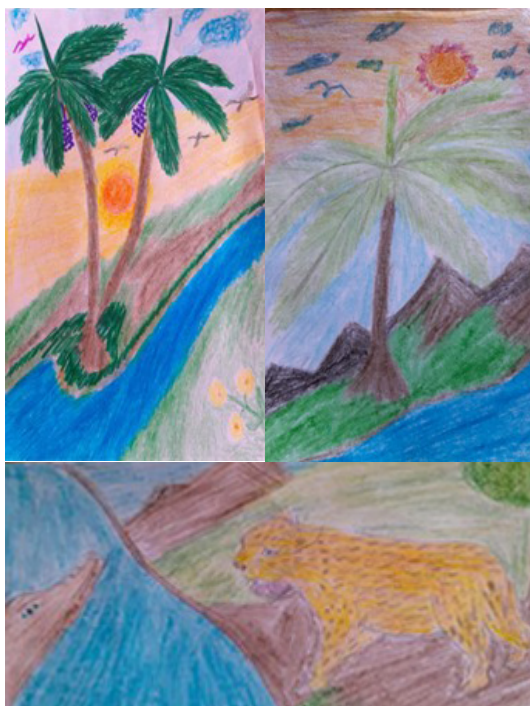
Figura 06 - Ilustração Krikati