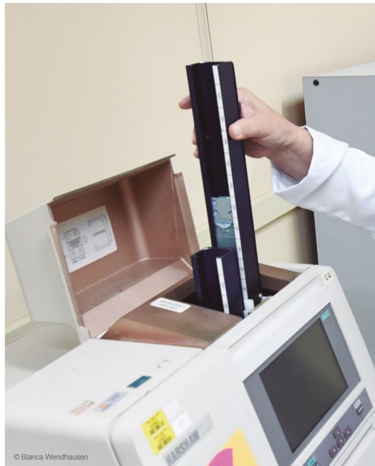
Diversos tipos de análises são desenvolvidos no CRCN-NE