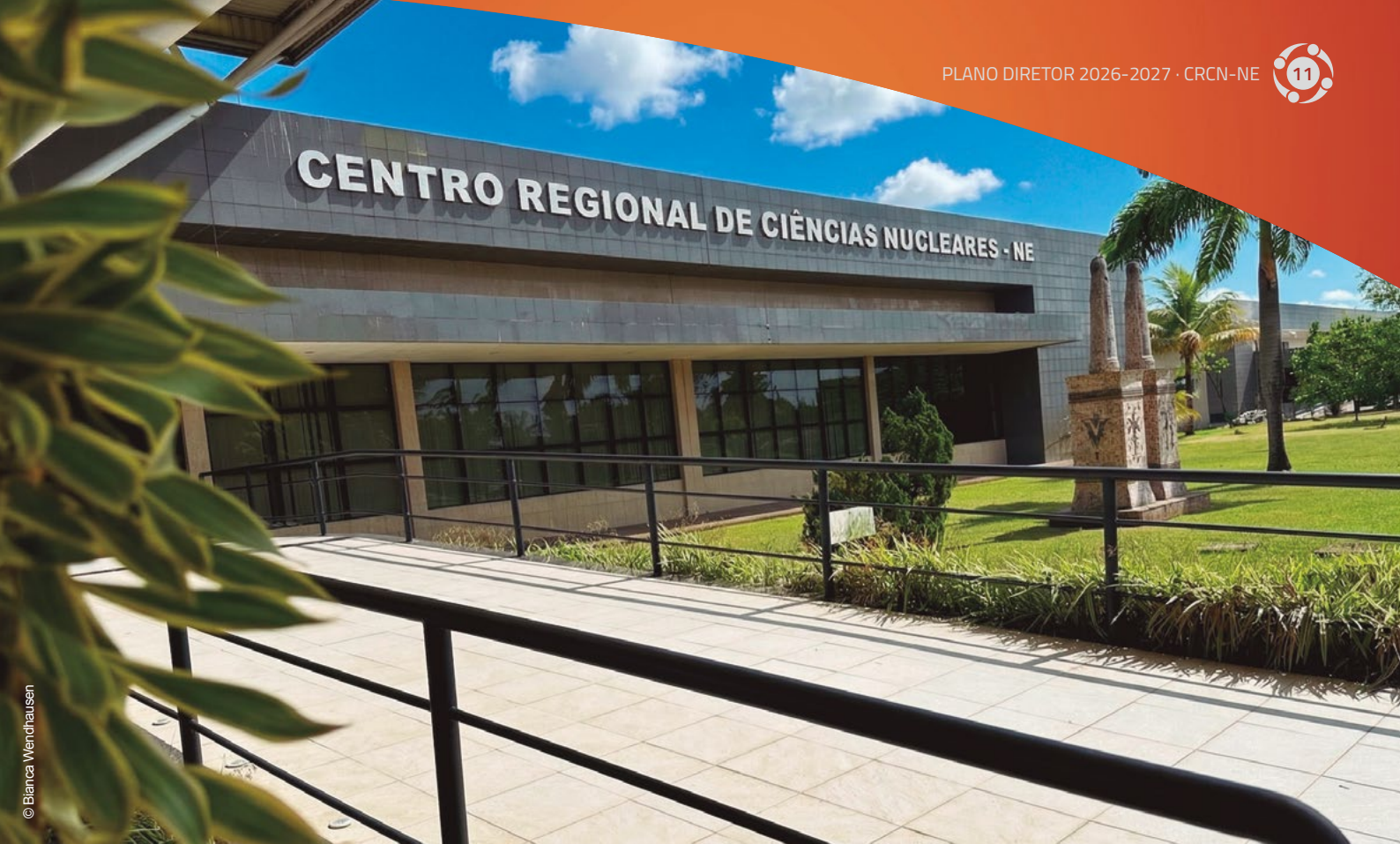
Prédio da Diretoria e do Serviço de Gestão Institucional

Ao longo de quase três décadas, o CRCN-NE se consolidou como referência no uso de radiações ionizantes e de técnicas nucleares em áreas essenciais — como Medicina, Indústria, Agricultura, Hidrologia e Meio Ambiente. Além de desenvolver pesquisas e oferecer serviços especializados, cumpre um papel institucional fundamental: formar novos profissionais, receber e acondicionar rejeitos radioativos de maneira segura e responder a emergências radiológicas que demandam atenção imediata e capacitação técnica, no âmbito da CNEN.