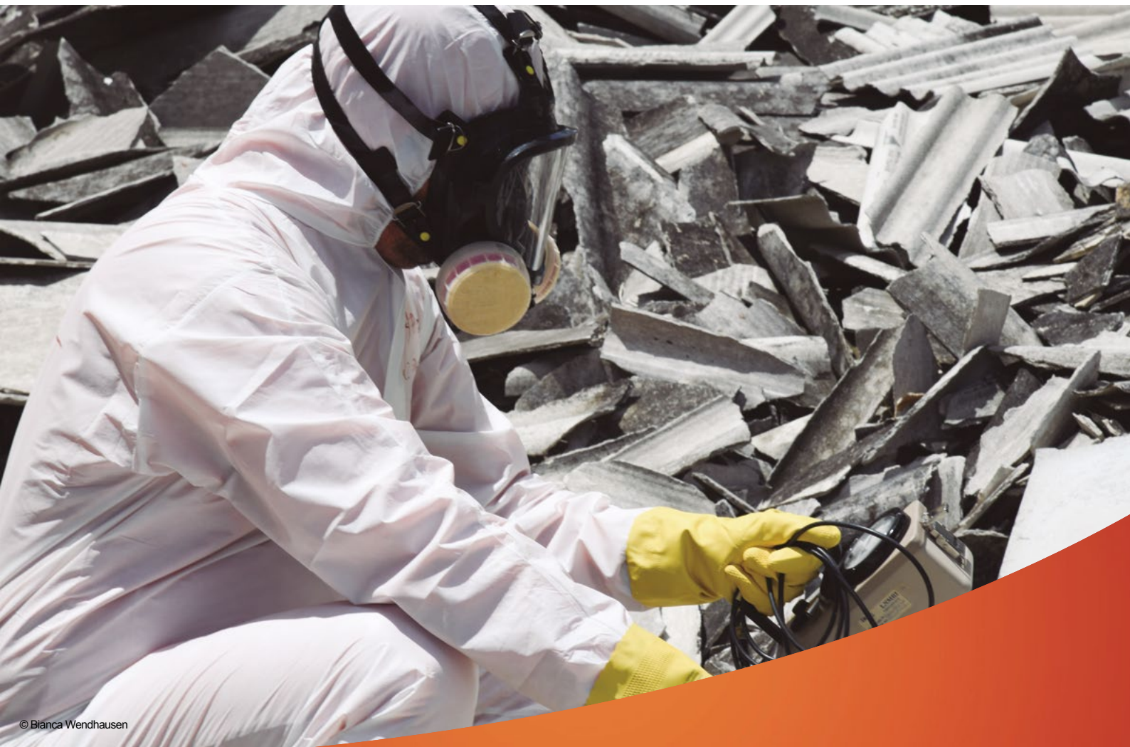
Simulação de detecção de radiação - SEARI