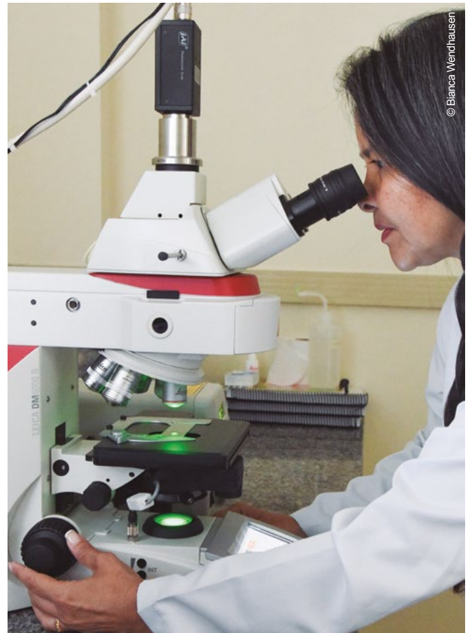
Laboratório de Dosimetria Biológica