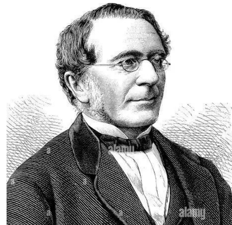
Rudolf von Ihering (1818-1892)