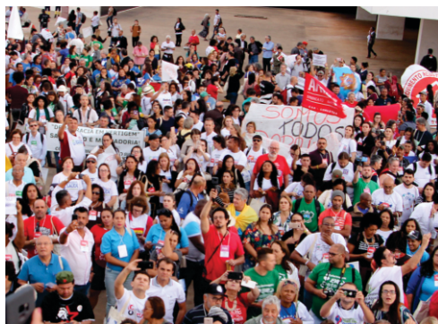
Movimentos sociais na defesa do SUS.

O eixo debaterá o momento do SUS como expressão política do direito humano à saúde e exercício da cidadania, amparado nos seus princípios e diretrizes fundamentais que são basilares do estado democrático de direito, buscando identificar avanços e retrocessos nos 34 anos do Sistema.