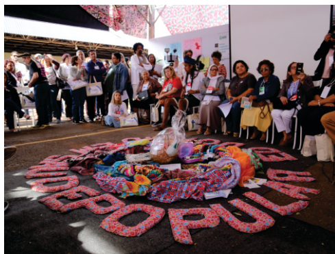
Durante Conferência ocorrem diversas atividades autogestionadas.

As Atividades Autogestionadas ocorrem durante a etapa nacional. São atividades de caráter não