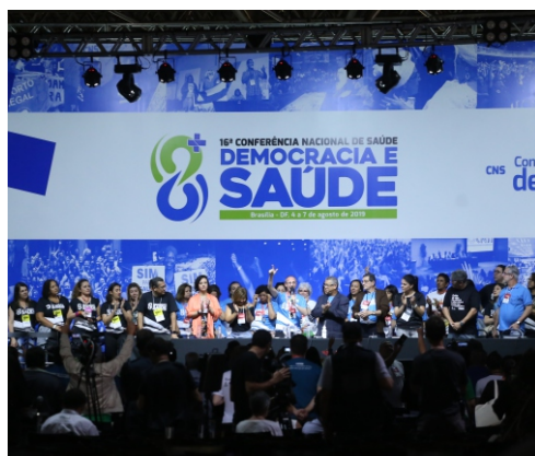
Encerramento da 16ª Conferência Nacional de Saúde, em 2019.

paritária, as delegadas e os delegados que participarão das conferências estaduais. A partir das discussões realizadas nas três etapas da Conferência Nacional de Saúde são definidas diretrizes a serem incorporadas nos Planos