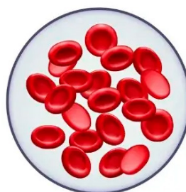
aparência padrão das hemácias

A talassemia é um grupo de doenças sanguíneas hereditárias, ou seja, passadas de pais para filhos. Ela é ocasionada por mutações genéticas que afetam a produção de hemoglobina, uma proteína rica em ferro presente no interior dos glóbulos vermelhos do sangue (hemácias) e responsável pelo transporte de oxigênio no organismo. Como consequência, a