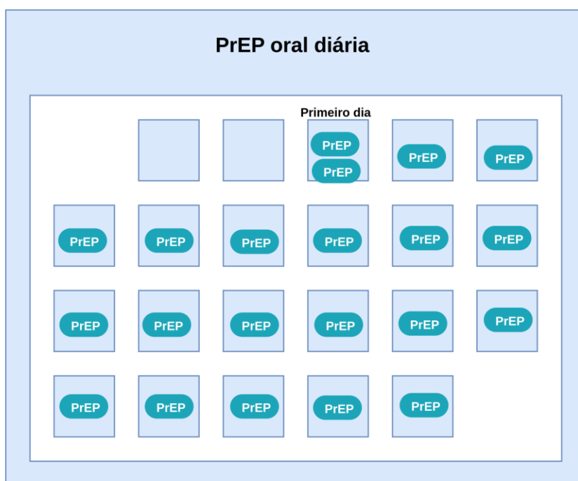
Figura 2. Esquema para a PrEP oral diária

A PrEP oral diária deve ser a modalidade de escolha para pessoas com hepatite B crônica (com e sem indicação de antiviral) pela possibilidade de indução de resistência do vírus da Hepatite B ao tenofovir, decorrente do uso intermitente do medicamento.