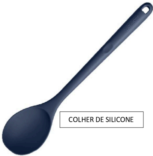
COLHER DE SILICONE