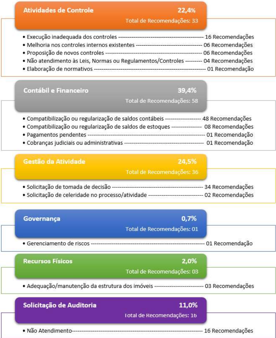
Tabela 08 - Categoria das recomendações da ação Gestão da Contabilidade

Do total das recomendações emitidas, 39,4% concentram-se na categoria “Contábil e financeiro”, com destaque para a subcategoria “Compatibilização ou Regularização de Saldos Contábeis” que representa 32,6% do total das recomendações dessa ação, conforme tabela abaixo.