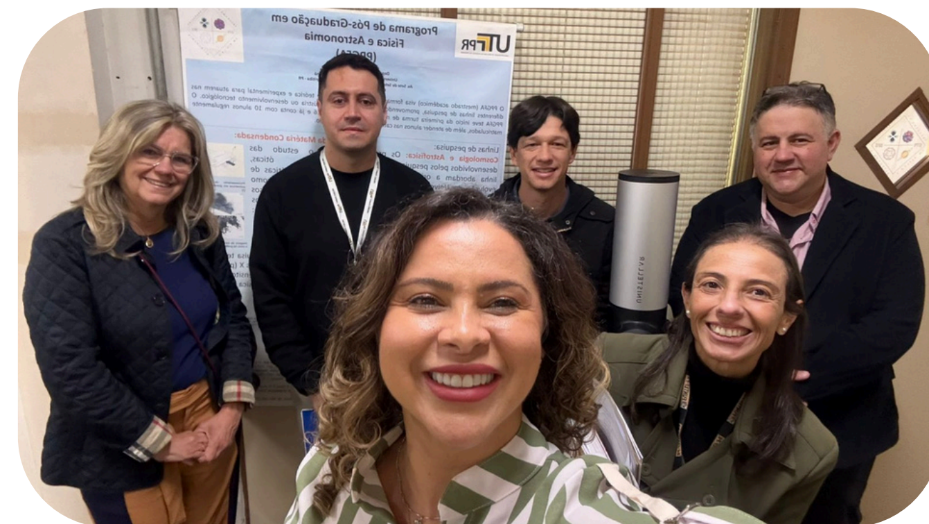
Comissão de verificação do CNPq e equipe da UTFPR