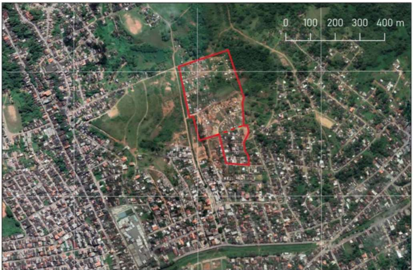
Figura 2 - Poligonal que compreende as comunidades.

O município de Simões Filho faz divisa com Salvador, tendo sido área deste município até o início da década de 1960, e conta com aproximadamente 115.000 habitantes, segundo o Censo 2022. A ocupação da comunidade Alto da Conquista se inicia em 2007, através de população deslocada de territórios periféricos de Salvador, notadamente o Subúrbio Ferroviário. Sua expansão para a área contígua, que conformaria a comunidade Marielle Franco, se faria apenas em 2019. Atualmente, as duas comunidades possuem cerca de 400 famílias. (Figuras 1 e 2).