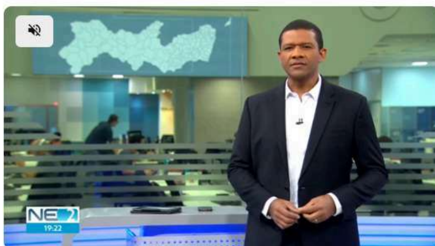
Projeto de compartilhamento de bikes em comunidades beneficia moradores de baixa renda

Um projeto da Associação Metropolitana de Ciclistas do Recife (Ameciclo) e do Centro de Ensino Popular e Assistência Social de Pernambuco (Cepas) tem beneficiado moradores de comunidades de periferias do Recife. Por meio da ação, chamada de "Bota pra Rodar", é possível