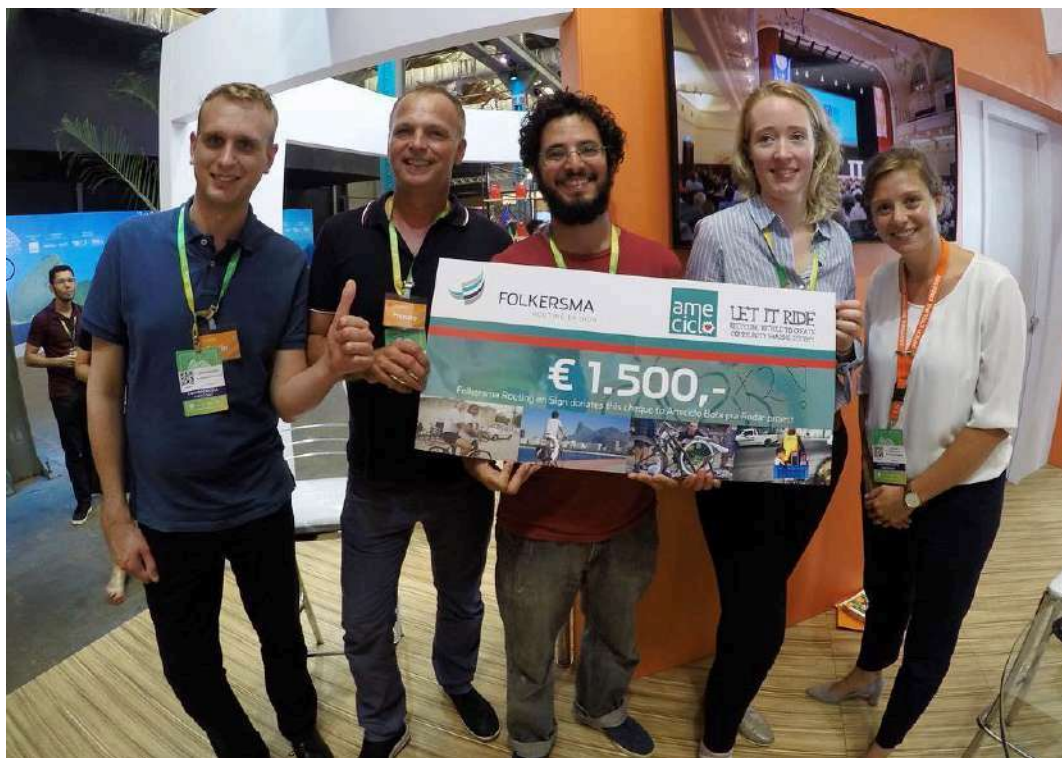
Prêmio Folkersma, 2018, Rio de Janeiro - RJ.