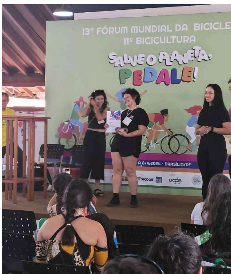
Prêmio Promovendo a Mobilidade por Bicicleta pelo projeto Oficina Escola Bota pra Rodar, da Transporte Ativo, 2024, Brasília - DF.