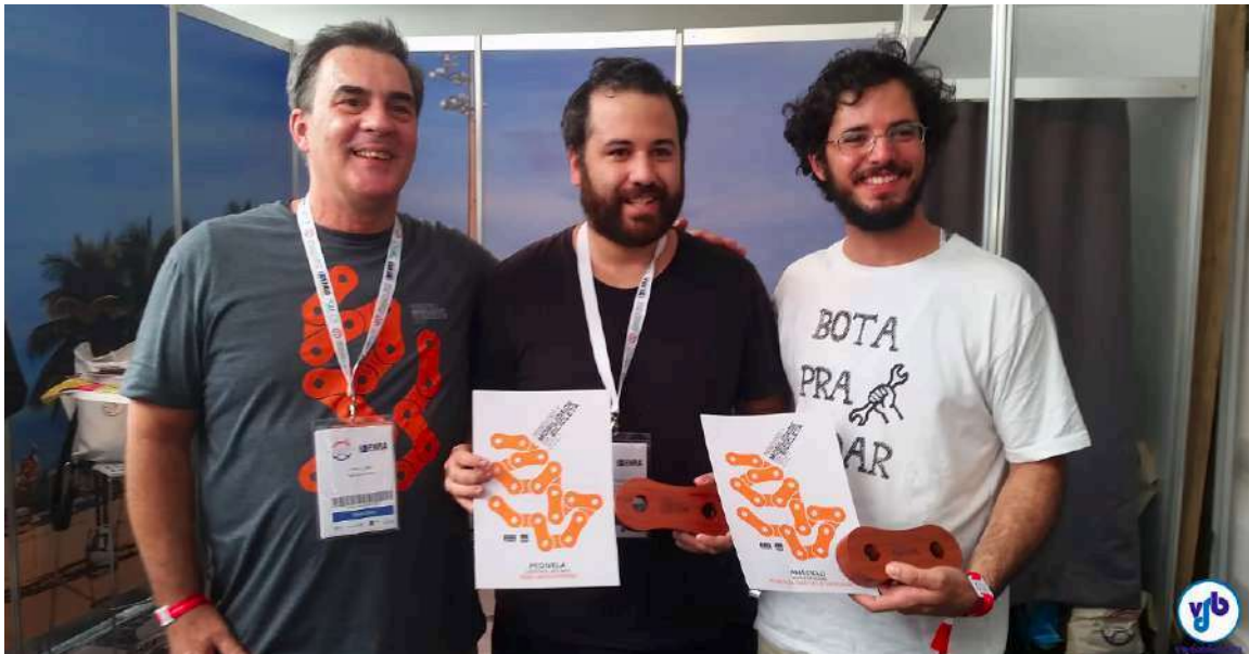
Prêmio Promovendo a Mobilidade por Bicicleta, da Transporte Ativo 2017, Rio de Janeiro - RJ