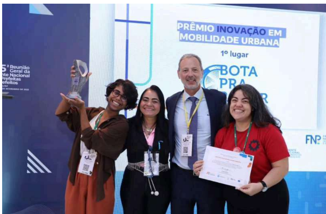
Prêmio Inovação em Mobilidade Urbana, da Frente Nacional de Prefeitos 2023, Brasília - DF.