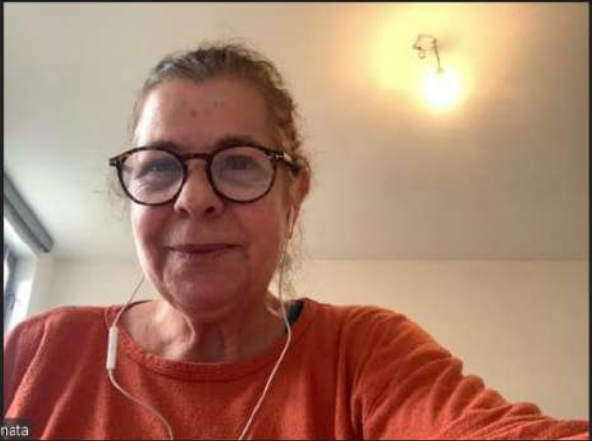
iPhone de Renata